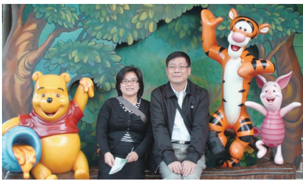
曾銓漸總經理與創意總監的妻子都喜愛兒童作品。

他清楚的記得當年，替兒子選擇圖書讀本時，發現幾乎全是迪士尼或者伊索寓言等國外作品時，就動念，也付諸實際的將中國的好故事，製作成繪本，更進而以淺顯有趣的動畫方式呈現，使孩子們輕鬆的接觸了諸如螳臂擋車等等屬於中國人自己的寓言故