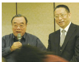
簡漢生理事長與來台參訪的民革中央副主席鄭建邦合影。