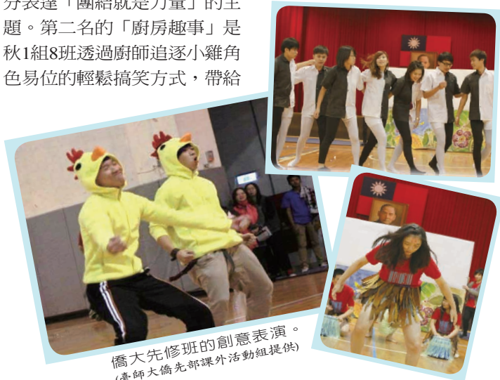
僑大先修班的創意表演。(臺師大僑先部課外活動組提供)

各獎項詳細辦法除已由僑聯總會分函各海外相關單位及華校外，並已同步於僑聯網站(www.fccat.org.tw)公布，請直接下載參考。