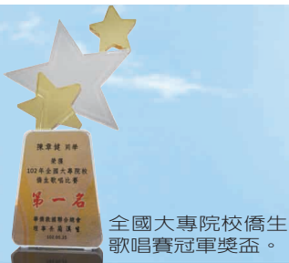
全國大專院校僑生歌唱賽冠軍獎盃。

華僑救國聯合總會 發行人：簡漢生 地址：10045台北市重慶南路1段121號7樓之16 電話：+886-2-23759675 傳真：+886-2-23752464 網址：http://www.focat.org.tw E-mail：focat@ms51.hinet.net