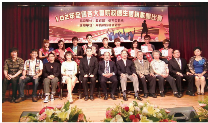
全體得獎僑生和與會貴賓及評審老師合影。