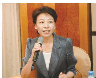
焦豫汝書記強調大家都是中國人。

老家」、在台灣舉辦河洛文化研討會，以及建議在固始陳集鎮，建立開漳聖王陳元光祖廟、建議舉辦大規模87姓後裔聚光州等諸多密切接觸，這些對於河南作為中原經濟區都有著很重要的價值，而對研究並彰顯開漳聖王陳元光的功績更具深意，因為只有將歷史的傳承建構到