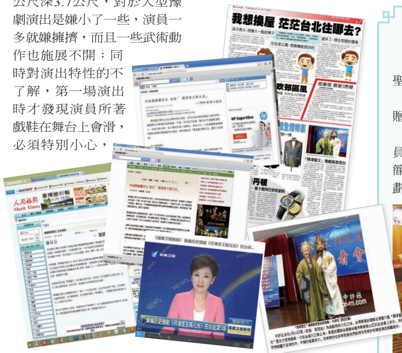
中國時報、聯合晚報、中廣公司、人間福報及福建衛視新聞、中評網等兩岸媒體報導豫劇活動。