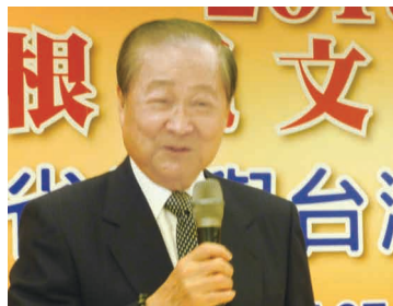
總統府資政饒穎奇對會議的成果豐碩表示值得慶賀。