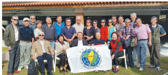
參與巴西台灣商會慶祝父親節一日歡活動的會員合影。