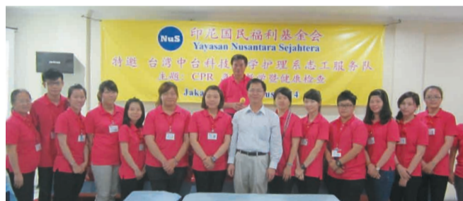
中台科技大學護理系國際志工團在印尼國民福利基金會教授心肺復甦術。(轉載自宏觀僑務新聞網)

訪團感謝駐印尼代表處的全程協助，也對蘇北留台同學會、西加留台同學會、新光明印華學校、日惹客屬聯誼會、中爪哇留台同學會等主辦單位的大力協助，表達最深謝意。