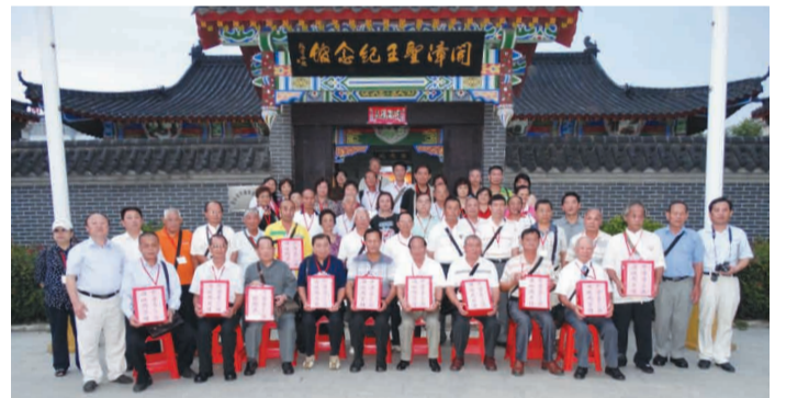
全體團員在開漳聖王紀念館前合影。