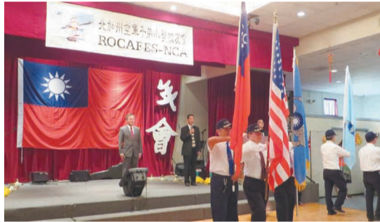
北加州空軍子弟小學校友會舉行空小建校80周年暨2014年年會，計約350人出席。