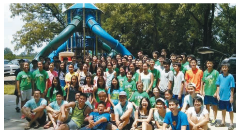
美東南區中文學校聯合會及亞特蘭大中華文化學校舉辦2014年美東南區華裔青年夏令營同學會，出席學員合影。