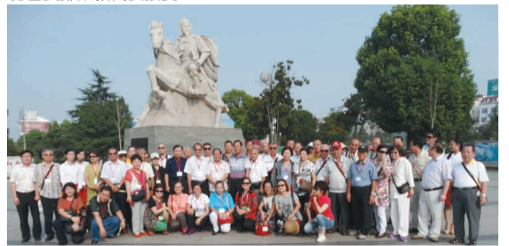
全體團員在陳元光廣場合影留念。