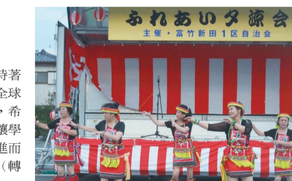
山梨台灣總會在日本甲斐市龍王町富所新田1區的黃昏納涼會中，帶來精彩的台灣原住民舞蹈。