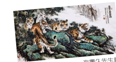
方書久先生畫作「五福同堂福壽臨」。