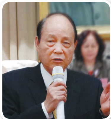
林中森董事長期待兩岸合作，達到世界大同的理想。

僑光社 / 台北 財團法人海峽交流基金會董事長林中森博士表示，在全球化浪潮下，兩岸不僅應加強經貿合作，更應加強教育、文化、宗教、科技、環保、體育等方方面面之交流合作，共同引領全球發展，讓世界對我們刮目相看。