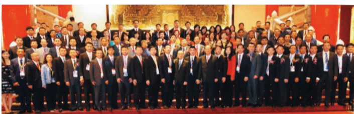
晉江商會第一屆成員合影。