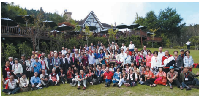
全體團員在山上人家合影留念，大家相約明年見。

大夥或站或坐或臥，眼前有如一泓清流，雖無大波大瀾，卻如一種不同時間、不同角度的凍結，咔嚓一聲，成了生命的永恆紀念。遠處的山脈，被雲霧所籠罩，層層山稜疊翠，讓人心曠神怡，令人不忍多閉眼。所有參加的本會的理事、顧問與會員，暫拋平日瑣事、煩悶，在幽雅脫俗的山林，讓身心得到修養與解脫，紛紛對行程安排與本會人員貼心服務大為稱讚。