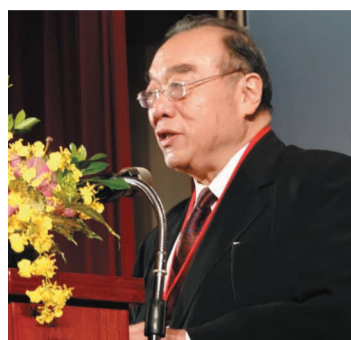
簡理事長應邀晉江商會致詞。

又訊 / 台灣晉江商會第一屆監事宣誓就職與兩岸文化經貿交流聯誼活動，10月23日在台北圓山飯店盛大舉行，第