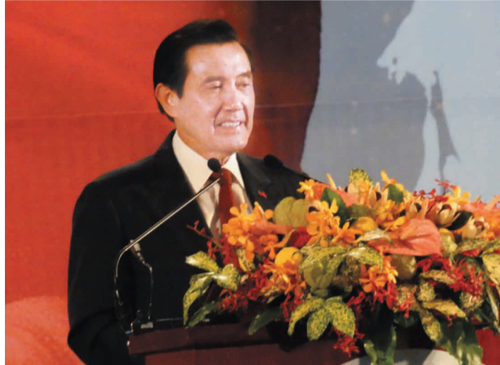
馬總統表示，僑胞是中華民國革命建國、抗戰救國與投資興國三大重要資產。

僑光社 / 台北 總統馬英九10月21日下午出席「103年華僑節慶祝大會」，致詞時強調他由自己年輕時在美國與僑胞互動，從政以來與全球僑胞往來的經驗中，深刻體認並敬佩僑胞是中華民國革命建國、抗戰救國與投資興國最重要的資產。