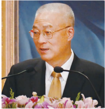
吳副總統在僑聯海外理事會開幕典禮致詞，強調僑力即國力。

僑聯總會簡漢生理事長歡迎僑胞回國參與盛會，更感謝吳副總統百忙中親臨會場，表示當年發生僑委會可能被裁撤的時候，吳副總統堅持必須保留，充分顯示他重視僑務，務期維護僑胞最大權益的心意。