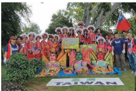
台灣留學生穿著原住民阿美族服飾組隊參加2014年夏威夷Aloha Festival遊行。(轉載自宏觀僑務新聞網)

夏威夷台灣人中心援例邀集夏威夷大學及夏威夷太平洋大學的台灣留學生與老師50多人參加遊行，穿上台灣原住民阿美族服飾及印有中英文台灣字樣圖形T恤，在隨風飄揚的中華民國國旗引導下，洋溢活潑愉悅笑容，向觀眾揮手致意。隨行的3尊三太子更是吸引許多家長及小朋友注目，一起合照擁抱，留下歡樂的影像。(轉載自宏觀僑務新聞網)