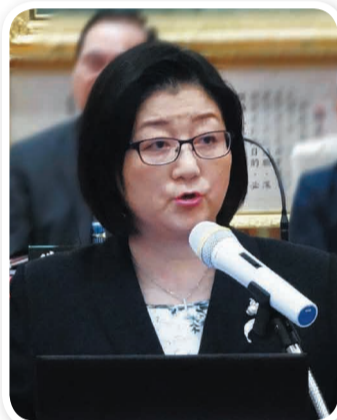
雷倩執行長表示，中國的和平穩定、持續發展，是新興經濟體的「成長驅力」。

APEC，中國領導人已經積極與全球領袖進行制度與價值的對話；值此世局極度動盪之秋，中國的和平穩定、持續發展將是世界另一個重要「核心」，更是新興經濟體的「成長驅力」。