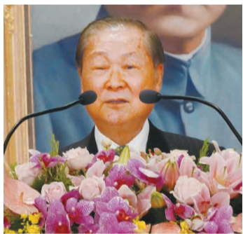
饒穎奇資政敬佩華僑為國家的貢獻。

副總統致詞時表示，103年前先賢先烈犧牲奉獻，歷經黃花崗之役、鎮南關之役及武昌起義等大小戰役，終於創建中華民國成為亞洲第一個民主共和國，華僑在過程中不僅捐輸財產，更奉獻出寶貴的生命；其後在對日八年抗戰中，華僑再度投入人力物力支援抗戰，協助國家抵抗外侮與復興中華民族；至政府播遷來臺，施行「獎勵投資條例」，海外華僑亦積極返國投資，促進我國經濟成長與社會發展，貢獻卓著。