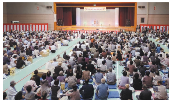
日本山梨縣敬老福祉大會，老人們認真的欣賞表演。