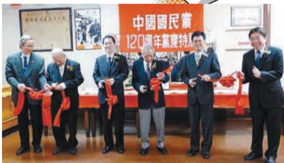
中國國民黨120周年慶圖片特展開幕典禮。