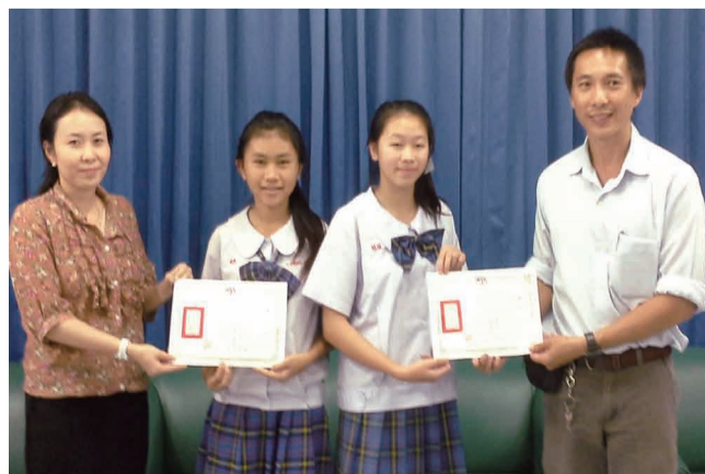
泰國難府新中學校103年分發獎狀給學生，學生十分高興！