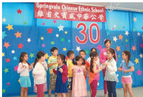
澳洲史賓威中華公學學生們表演歌舞。