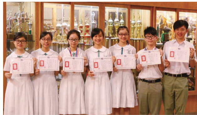
香港培英中學七名得獎學生笑得好開心。