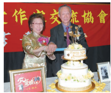
心水、婉冰合切金婚蛋糕。