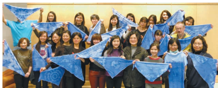
荷蘭台北學校舉辦教師培訓一藍染講座與體驗，30位教師與眷屬參與。(轉載自宏觀僑務新聞網)