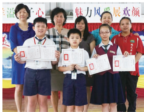
馬來西亞珠巴中華公學得獎同學與老師合影，好榮耀！

馬來西亞美里珠巴中華公學、香港培英中學、泰國難府新中學校、韓城華僑小學及緬甸臘戌明德中學參加僑聯總會舉辦103年徵文、書法繪畫比賽，獲得優勝的同學，在各校接受頒獎後與師長合影。（圖片由各學校提供）