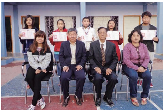
緬甸臘戌明德中學 徵文獲獎同學與校長、輔導教師合影。