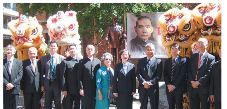
國父冥誕獻花儀式，政要與僑領們合影。