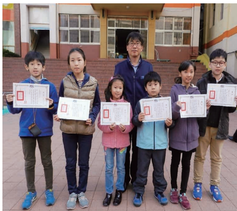
韓城華僑小學得獎同學告訴老師，明年還要參加比賽。