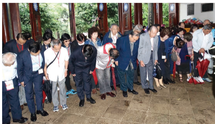
參訪團在簡理事長率領下，前往國殤墓園祭拜，追思陣亡烈士。