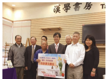
洛杉磯僑教中心表揚優良讀者活動，邀請在中心圖書室借閱超過千本的會員分享心得，並頒發獎狀。