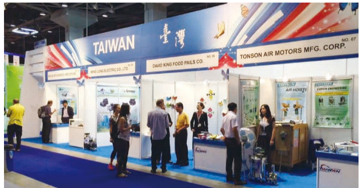
臺灣館在以國科技展以整體形象呈現。(轉載自外交部網站)

以色列是重要的科技創新國家，與我國全球知名的產品商業化能力正好可以互相搭配，雙方合作空間甚大。2014年我國自該國進口的晶圓檢測設備達2.75億美元，占該國對我外銷金額的39%，可見以色列高科技商品的實力。我國的HTC、上銀科技及華邦電等大廠均全力在以布局，是一個值得深耕的市場。(轉載自外交部網站)