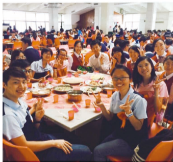
面對台灣特色美食，僑生大快朵頤。