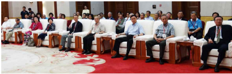
黃毅部長（上圖右）與簡漢生理事長（上圖左）交換意見，並熱忱接待訪問團（下圖）。

僑光社／雲南 本會組織的「海峽論壇參訪團」離開雲南前，意外的接受雲南省委常委兼統戰部長黃毅宴請。這原本不在行程中的安排，因黃部長獲知參訪團即將回台，特地騰出時間，與參訪團見面座談與餐敘。