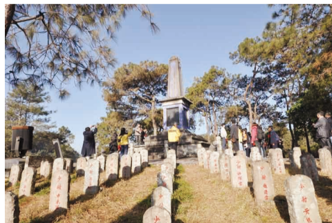
國殤墓園內經常有民眾前往憑弔祭拜。