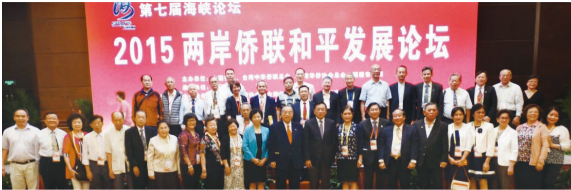
本會簡理事長（前排右十一）、中國僑聯林軍主席（前排右十）及參訪團在兩岸僑聯和平發展論壇會場合影。