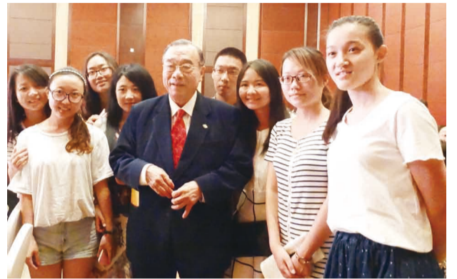
廈門大學學生應邀參加兩岸僑聯和平發展論壇見習，看到簡理事長（中）爭相合照。

僑光社 / 由中國僑聯、中華僑聯總會等合辦的「2015兩岸僑聯和平發展論壇」6月14日在廈門召開，以「牽手合作、共同發展」為主題，兩岸僑界共同為鞏固和擴大兩岸民間交流尤其是青年交流建言。