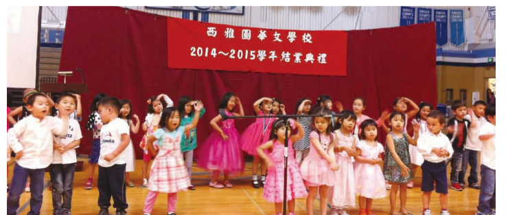
西雅圖華文學校舉行畢業典禮，學前班同學表演。