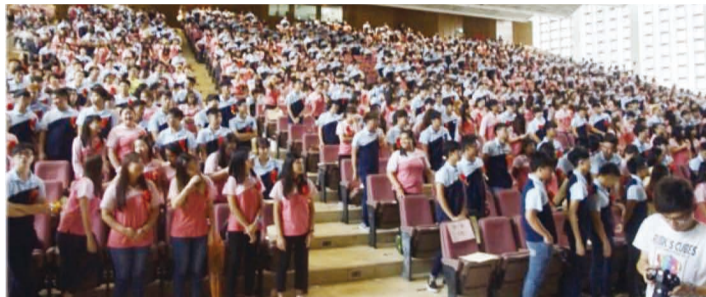
僑先部學生參加畢業典禮。

由於今年結業典禮適逢僑先部60週年部慶，當天除了由結業生代表獻上師生共同創作的「相遇僑航60號登機門」專