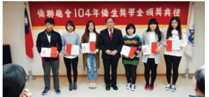
張標材理事長（左四）與得獎同學合影。