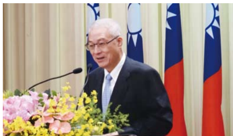
吳副總統多次親臨華僑節慶祝大會，並致詞肯定僑胞愛國赤忱。