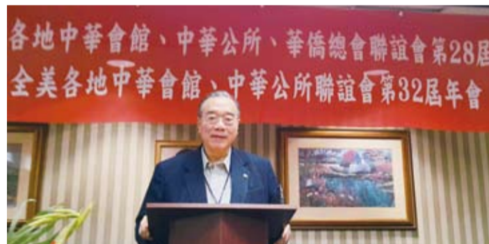
簡理事長應邀參加2015年美洲暨全美中華會館、中華公所年會，並在大會中致詞，強調僑胞是抵抗台獨的王牌。

的華僑華人正式組團來台訪問，6月9日至18日，歐洲地區32個國家27個大陸華僑華人社團負責人共39人接受邀請，來台進行「破冰之旅」。由於該