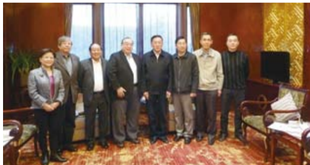
簡漢生理事長一行拜會大陸9個涉僑、涉台各單位，受到中國僑聯林軍主席等人熱忱歡迎。

在與大陸僑界交流方面，自2008年迄今，本會在台接待大陸及港澳地區僑界參訪團共計100餘團，總人數達1500人。同時，本會共組織了57次各類參訪團至大陸參訪，總人數更高達2000餘人，計涵蓋大陸京、津、魯、豫、閩、粵、浙、滬、蘇、徽、贛、冀、晉、陝、鄂、湘、滇、桂、黔、內蒙古、遼、青、川、渝及港澳等地。本會是台灣地區與海外及大陸僑界交流、連繫互動最頻繁、規模最大，人數最多的民間團體，交流成果深獲各界讚賞及肯定，其中尤以2009年本會邀請中國僑聯林軍主席以正式身份組團來台參訪，簽署加強合作交流協議書，開啓兩岸僑界互動之先河，最受矚目。