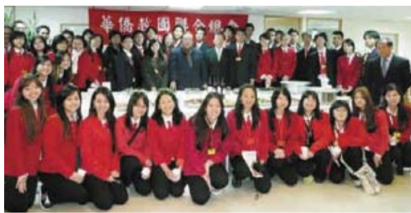
巴西華裔青少年研習團訪問僑聯總會。