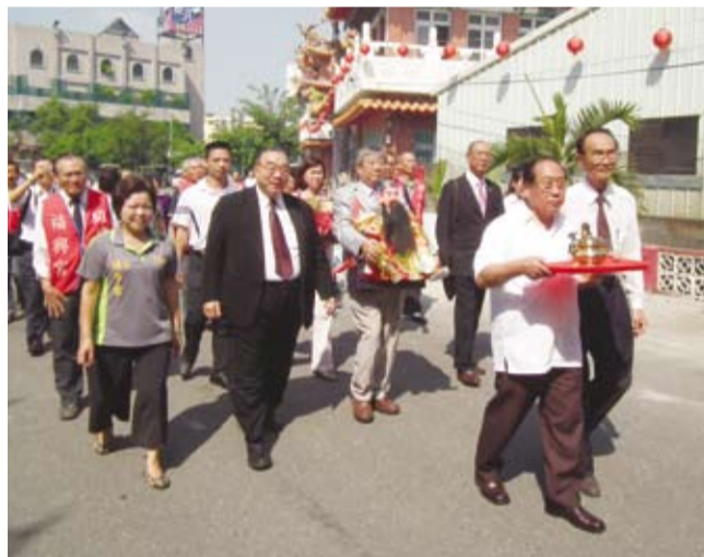
舉辦「開漳聖王回老家活動」，眾人恭送開漳聖王聖像出廟埕。