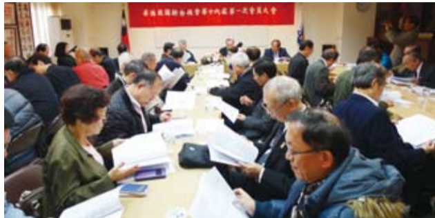
第16屆第一次理事會。

立台北大學社會所碩士，經歷國民大會秘書處出納科長、事務科長、總務組副組長、國大代表全國聯合會秘書長等職，學經歷完整。