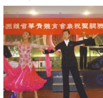
維省華青體育會少年男女精彩舞蹈表演。