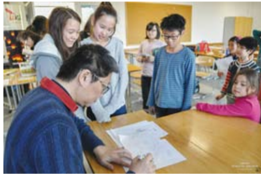
台灣漫畫家敖幼祥在漫畫研習營指導慕尼黑中文學校學生。(轉載自宏觀僑務新聞網)

慕尼黑 / 在睽違兩年後，慕尼黑中文學校及德國台灣協會元月12日再次合作舉辦漫畫研習營，協會會長劉威良邀請台灣漫畫四大才子之首的《烏龍院》作者敖幼祥及台灣漫畫家林莉菁，帶給學校師生難忘的漫畫體驗，並座談「我的人生經驗談」。