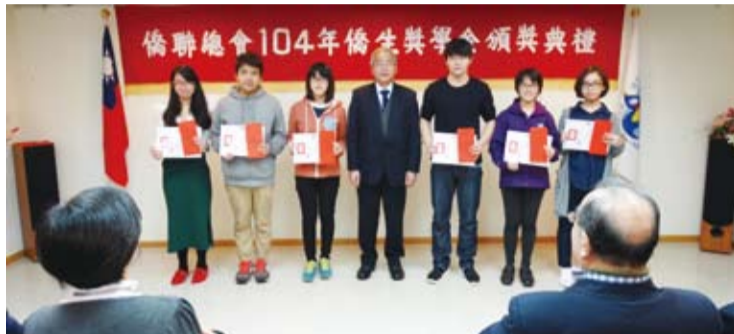
許派財監事（左四）與得獎同學合影。