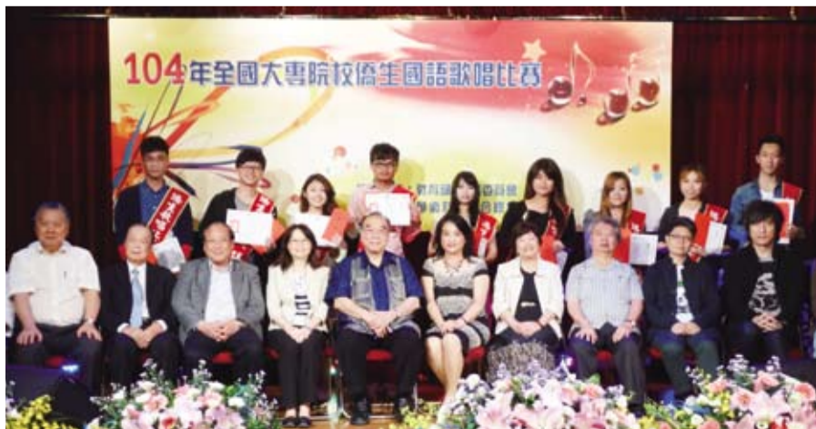
僑生歌唱比賽全體得獎僑生和與會貴賓及評審老師合影。

透過這些活動，從河洛文化與台灣文化、客家文化、海外華人文化、與台灣文化的融合發展、民間信仰習俗等，以傳統現代創新再造讓中原文化在台灣呈現，兩岸攜手同心，人不親土親，兩岸同根同源，本是一家人，親上加親，同時深入了解台灣在中華文化保存上努力，對於雙方日後交流有了初步的溝通，並增進了解與認識，拉近距離化解不必要隔閡。透過兩次的研討會，更進一步深化了兩岸的認知，相信透過文化交流，對未來兩岸的和平發展有一定程度的助益。