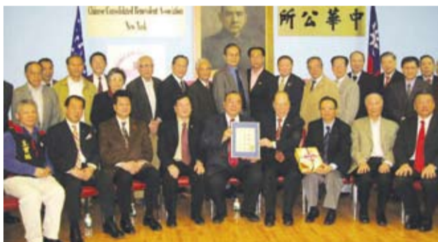
2009年簡理事長訪問紐約中華公所，受到僑界熱烈歡迎。