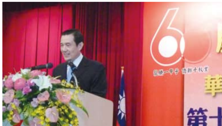
馬總統兩度親臨華僑節大會致詞。

華僑救國聯合總會簡漢生理事長自2008年接掌僑聯總會迄今，馬英九總統兩度親臨華僑救國聯合總會主辦的華僑節慶祝大會，給予簡理事長「乃役於僑」肯定的最高榮譽。2009年中國僑聯參訪團，由主席林軍率領一行8人抵台進行破冰之旅，6月8日與本會簡理事長漢生代表兩岸僑聯簽署「合作交流協議書」，揭鑿「和諧僑社」共識，求同化異，促進和平發展，在兩岸民間交流與僑界交流上開創了新局，留下了重要的歷史記錄……，凡此種種，使僑聯總會終能以「僑務工作是民族層次工作」自我期許，在兩岸僑社能見度大幅提昇，更因此有能力堅持承擔「服務僑界，匯聚僑社力量，貢獻兩岸和平發展」的時代使命，本刊特就連繫服務海外僑胞、促進兩岸和平交流、傳揚中華文化三大項整理報導如下：