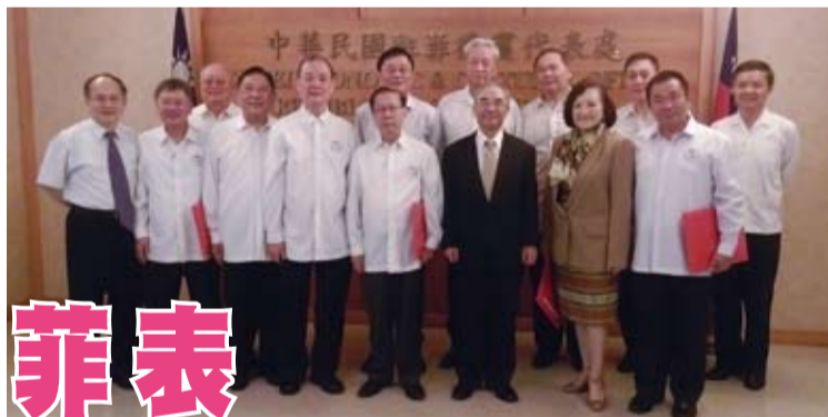
菲華文經總會4位新屆常務委員及重要幹部拜會駐菲代表處。