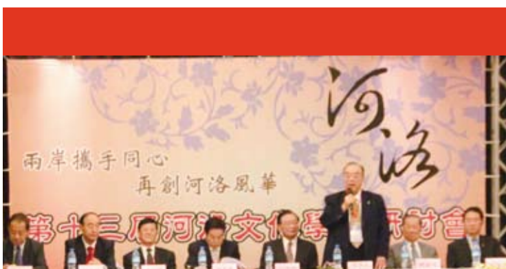
第十三屆河洛文化研討會再度在台北舉行，2015年10月12日開幕式主席台上的貴賓。