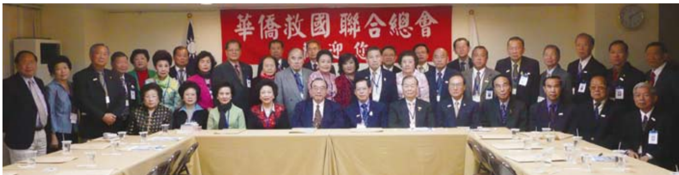
泰華訪問團與僑聯理事長合影。