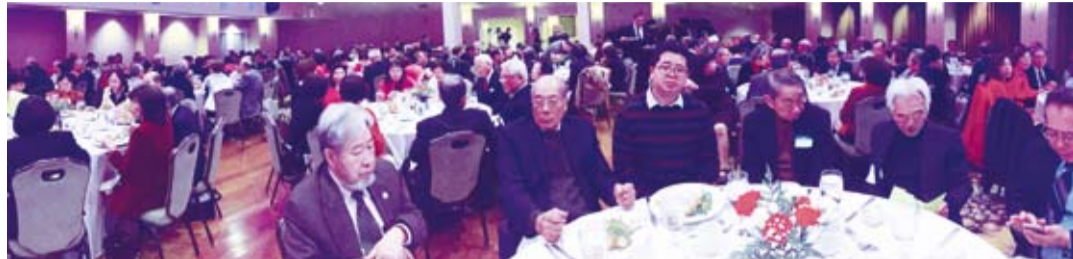
大紐約區海外台灣人筆會第12屆年會暨新年晚會，200位來自紐約上州奧伯尼、長島及紐澤西等大紐約地區會員參加。