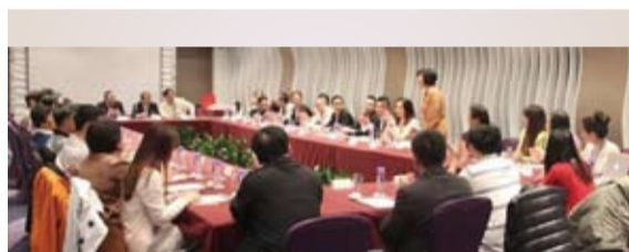
「海外優秀青年中華文化研習營」舉行交流活動。

曲阜 / 由中華僑聯總會理事長鄭致毅擔任團長的「海外優秀青年中華文化研習營」18名團員，4月23日上午拜會了中國僑聯副主席、上海市僑聯主席沈敏及上海市僑聯青年委員會，並與上海僑聯青委會的海外僑青舉行了交流活動。