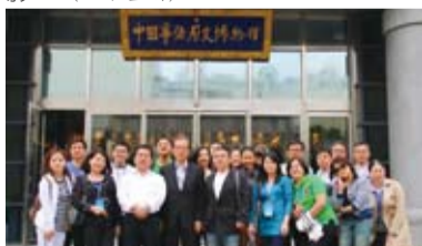
大夥在中國華僑歷史博物館門前合影留念