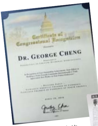
美國國會議員趙美心的恭賀狀，對他致力建構僑社交流的成效表示敬佩。

是連繫海外僑胞、僑校、服務國內歸僑、關心僑生等僑務工作，對推動兩岸事務關係也多有貢獻，肯定僑聯是個突破黨派的高格局涉僑團體。