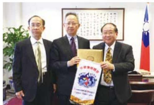
駐洛杉磯台北經濟文化辦事處夏季昌處處長（中）認為鄭理事長（右）訪洛城有意義，圖左是文光華主任。