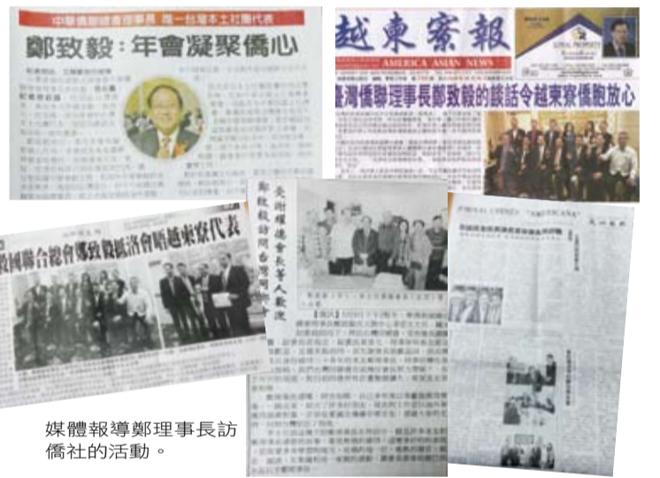
媒體報導鄭理事長訪僑社的活動。

賀電給鄭理事長，認為他的到訪，在華人僑社開創了不一樣的「連心」格局，令人佩服。世界日報、世界越東寮華人新聞週報、美洲華報巴西新