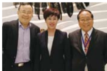
鄭理事長（右）與本海市僑聯青委會鄭好理事長（左）、上海市僑聯主席沈敏合影。

沈敏主席首先對鄭致毅先生今年二月榮任臺灣中華僑聯總會理事長表示熱烈祝賀，對來訪參加「海外青年臺胞中華文化研習營」的臺灣青年朋友們表示熱烈歡迎。她表示，