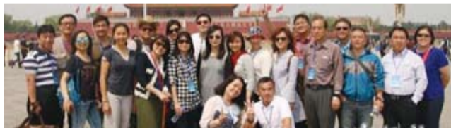
「海外優秀青年台胞中華文化研習營」一行天安門廣場前合影。