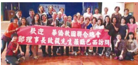
與巴西台僑聯誼會代表們合影。

鄭理事長行程包括：拜會美洲華報和聖儒華文學校、聖保羅中華會館、客屬崇正總會、客家活動中心、台北文化中心並參加台僑聯誼會慶祝母親節活動；拜會華僑天主堂，參加慶祝母親節活動、駐聖保羅台北經濟文化辦事處、台灣同鄉會、台商會與理監事相敘，此外鄭理事長也參觀了當地的中文學校和圖書館，並且