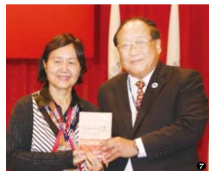
鄭致毅理事長贈送僑聯紀念光碟給與會貴賓： 1陳副總統、2馬前總統、3吳委員長、4洪主席、5葛維新先生、6童惠珍女士、7鄭雪霏女士。