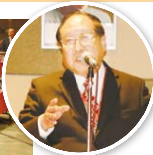
鄭理事長致詞強調要以行動服務僑胞。