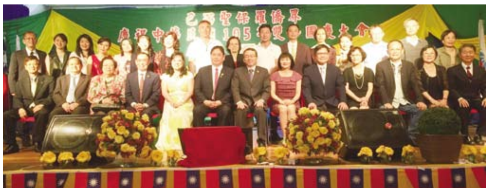
聖保羅僑界熱烈慶雙十。

聖保羅 ／由聖保羅中華會館主辦，巴西45個僑團協辦的慶祝中華民國105年雙十國慶聯歡大會，在聖保羅僑教中心二樓大禮堂盛大舉行，會場坐無虛席，有近6百位僑胞參加。大會中有頒發各項比賽的優勝者，還有唱歌、跳舞、摸彩等精彩節目，場面熱鬧喜氣洋洋溫馨。