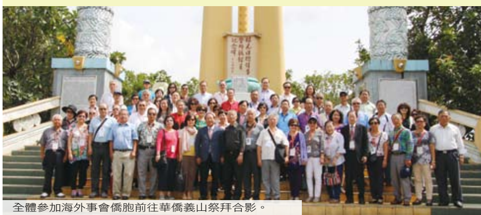
全體參加海外理事會僑胞前往華僑義山祭拜合影。