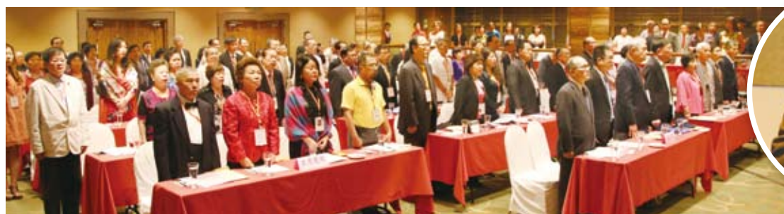
本會第16屆第1次海外理事會越洋在菲律賓馬尼拉召開。