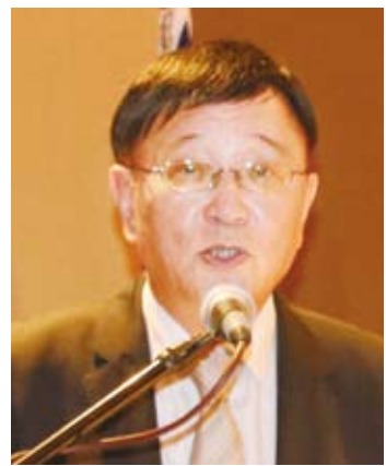
張泰來公使強調新南向政策有利台菲實質關係發展。

他說明新南向政策共有經貿合作、人才交流、資源共享及區域鏈結等四大工作主軸，務期從長期深耕、全方位發展的方向，尋求與東協10國、南亞6國及紐澳等18個目標國家，建立策略性夥伴關係，共創區域的發展和繁榮。他強調，深信現在就是灌溉中華民國(台灣)與菲律賓之間友誼的最佳時機，進而加強我們原已甚為密切的關係。在「新南向政策」的方針下，相信兩國的實質關係在未來將更加堅實穩固。