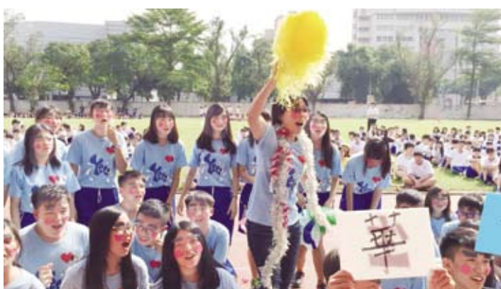
學生開心的參加校慶活動。

高二學生創意入場及高一學生大會舞出自學生巧思，口號動作花招百出，服裝設計爭奇鬥豔美不勝收，令人目不暇給，參加同學全力以赴，班級表現團結合作精神，比賽氣氛緊張激烈，啦啦隊吶喊助陣，加油聲音響徹雲霄。