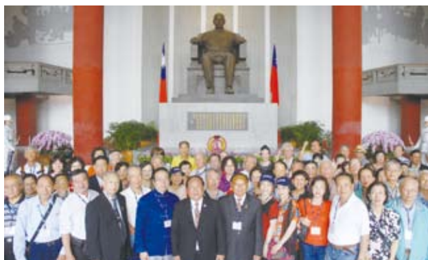
鄭理事長率僑胞代表向中山先生致敬。