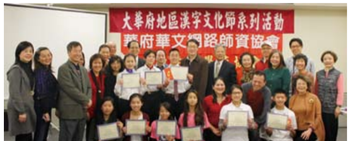
華府漢字文化節系列活動數位導覽競賽，獲獎同學與指導老師及評審合影。

府，發揚中華文化及服務僑生等等，成績有目共睹。更感謝各位僑彥蒞臨參與及支持僑聯總會會務，希望日後加強與辦事處聯絡，積極參與總會及辦事處之活動。