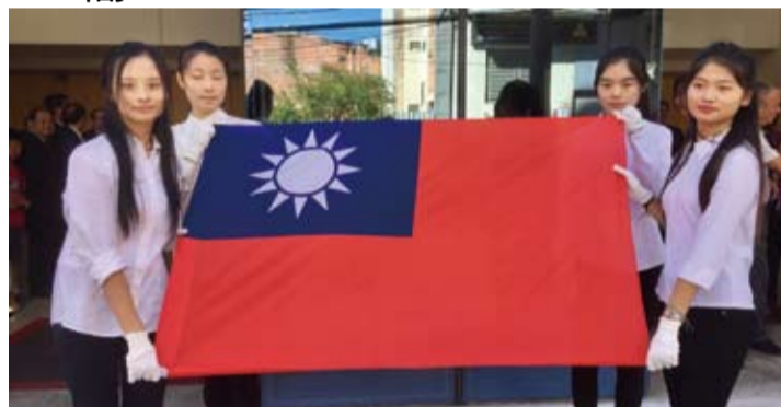
四位女青年持國旗入場。