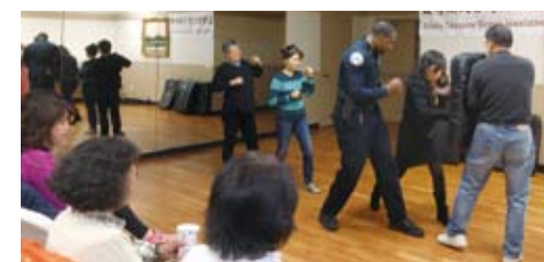
亞特蘭大台灣婦女會舉辦「婦女安全防身術講座」。