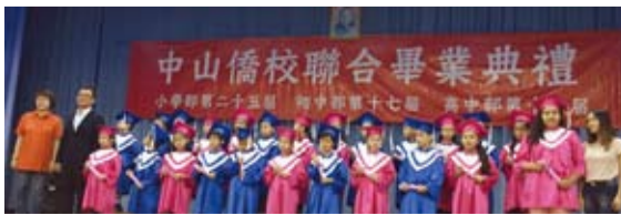
東方市中山僑校聯合畢業典禮 離情依依。