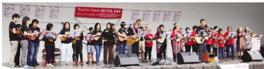
音樂藝術表演團體透過演出為台灣祈福。

活動結束前，主辦單位比照西班牙習俗，發給在場每一位觀眾5顆葡萄為新年許願祈福，吃下之後象徵今年國泰民安、風調雨順。