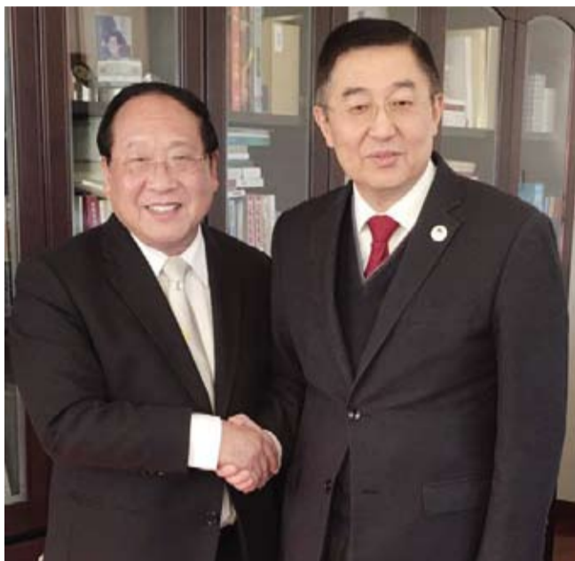
鄭理事長(左)拜會僑聯副主席，雙方相談甚歡。

當前兩岸關係發展遇到嚴峻挑戰，台胞社團都體認，此時此刻台胞社團承擔的歷史使命，更為重大。中國國民黨副主席林政則在致辭中代表國民黨對論壇的舉辦表示祝賀。