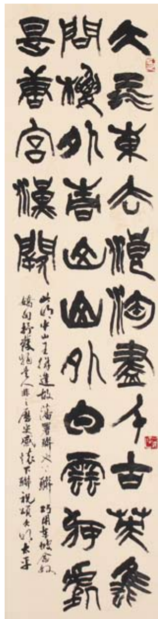
許建中 篆書／〈明·徐達故藩署聯〉

上聯：大江東去，浪淘盡千古英雄，問樓外青山，山外白雲，何處是唐宮漢闕；下聯：小苑春回，鶯喚起一庭佳麗，看池邊緣樹，樹邊紅葉，此中有舜日堯天。