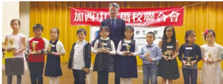
加西中文僑校聯合會舉辦的國語朗讀、硬筆寫字、畫報比賽舉辦頒獎典禮。(轉載自宏觀電子報)