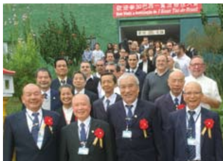
一貫道聯誼會全體大合影留念。