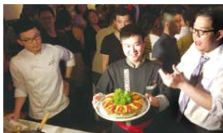
洛杉磯地區舉行「台灣美食廚藝巡迴講座」。