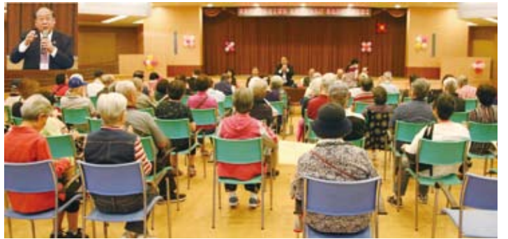
鄭理事長致詞（左上角）並與僑胞座談。

鄭理事長表示，看到僑胞在養生村生活愉快、身體健康，連他自己退休後也想到此長住，他指出，僑胞長年在國外打拼，就像無根的浮萍，年長之後落葉歸根，回到自己家鄉，僑聯總會就有無可旁貸的責任為僑胞給予溫暖的服務。他希望村內的僑胞能將僑聯總會當成自己家，有需要就直接連絡，家人之間不必拘束與客氣。