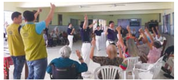
多明尼加台、粵籍及當地僑青共20餘人隨同慈濟志工前往多京的老人院探視老人。

多明尼加／多明尼加台、粵籍及當地僑青共20餘人於5月7日下午隨同慈濟志工前往多京的老人院Hogar de Anciano San Francisco de Asis探視該院百餘名老人，並發放愛心物資。