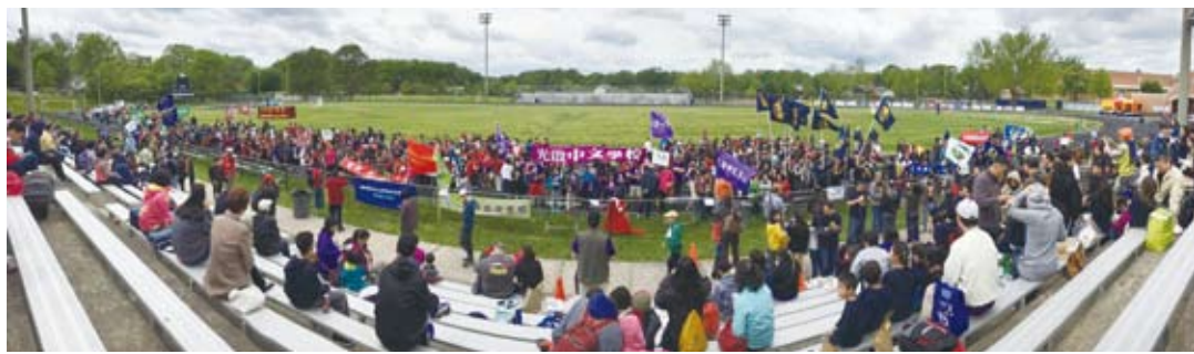
大華府地區中文學校聯誼會舉辦聯合運動會。(轉載自宏觀電子報)