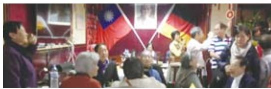
法蘭克福華裔相濟會宮舉行媽祖聖誕慶祝活動。