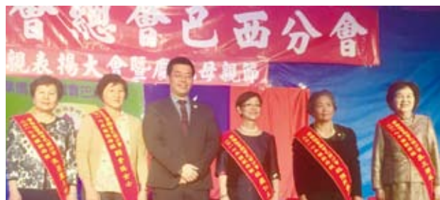
巴西僑界表揚模範母親。