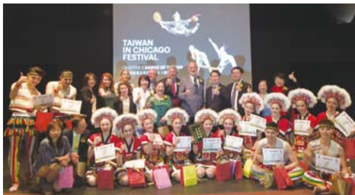
團員嘉賓演出後合影。

明尼蘇達／由國立臺灣藝術大學演出的「大觀舞集」5月5日及7日在明尼蘇達州首府聖保羅市River Center舉行的「2017年萬國節」(Festival of Nations)及芝加哥西郊Westmont High School體育館進行北美演出，與各族裔舞群同台競藝，精彩節