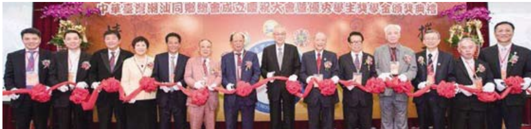
吳敦義前副總統(右七)剪綵，右六是李南賢會長。

李南賢會長感謝基隆、臺北、臺中、臺南、高雄等潮州(汕)同鄉會的磋商和積極籌備，共同串連起全臺灣的潮州鄉親熱心認同，經內政部批准成立，成為目前全臺灣唯一合法成立的潮汕同鄉