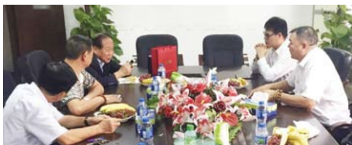
鄭理事長聽取澳門閩僑聯誼會業務簡報及建言。

他接著表示，擔任華僑救國聯合總會理事長，將服務僑胞放在第一位，以「坐而言不如起而行」的行動哲學，提出連繫海外僑胞、加強歸僑合作、持續兩岸交流的「三位一體」服務宗旨，7月才前往日本東京、橫濱及大阪拜訪僑社與僑校，獲