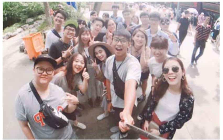
團員們自拍合影，留下青春回憶。