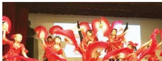
紐約華僑學校2017年暑期夏令營結業典禮及成果展，學生表演舞蹈「好運來」。