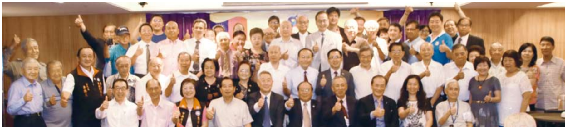
鄭理事長（前坐右五）與全體與會者合影。

僑光社／台北 華僑救國聯合總會8月21日舉行聯誼餐會，宴請本會最高顧問、理監事及參選國民黨中央委員的海內外黨代表，大家齊聚一堂進行交流。與會者一致表示，僑聯總會永遠將僑胞放在第一位，以服務僑胞為首要工作，而且不是空口說白話，是起而行不是坐而言，以行動力從事僑務