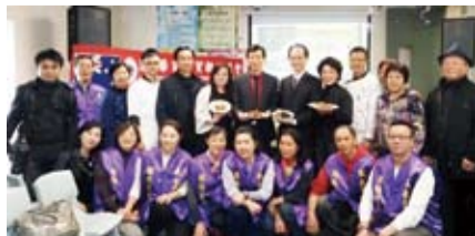
臺灣美食廚藝巡迴講座工作團隊合影。