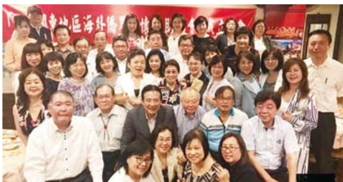
日本關東地區海外僑界關懷救助協會成立大會，與會者合影。