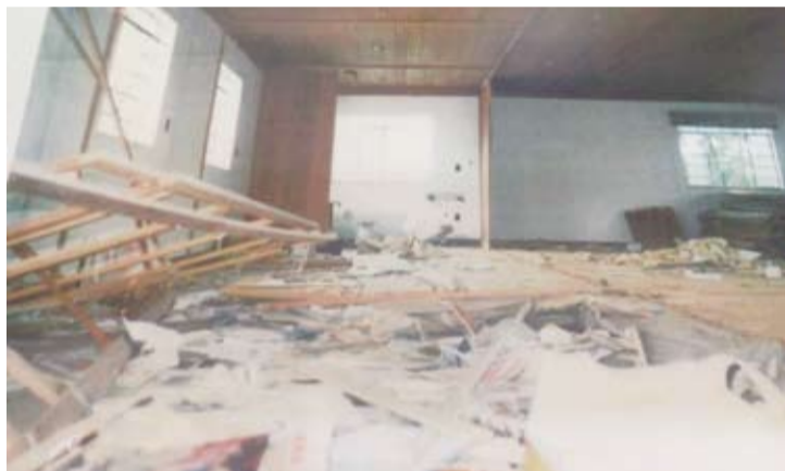
張大千在巴西的待拆八德園畫室一片狼藉，手澤函件棄置滿地。

那天的所見所聞真是駭人，序列首位。還記得1983年國畫大師張大千在巴西的園林—八德園，因當地政府擬建水庫而拆毀，致毅兄邀我同赴園址勘察，看能不能做搶救性的資料保護，為大師的名園留下最後的吉光片羽，永存藝史。