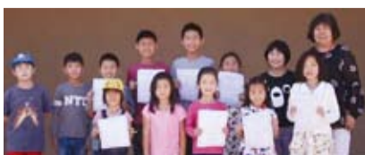
北郡中文學校舉行中文說故事比賽，提升孩子中文表達能力。（轉載自宏觀電子報）

有助於提高學生中文水平，鍛鍊其語言表現力及創造力的「中文說故事比賽」，題目由各班老師根據學生的程度自行制定，由各