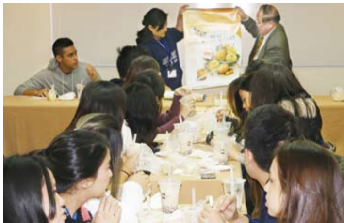
漂亮的水果月曆，受到團員們喜愛。