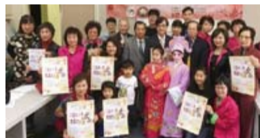
臺羅省僑界舉辦「兒童粵劇迎2018新春」活動。