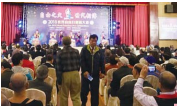
世盟總會舉行自由日慶祝大會。

台北／世盟總會1月23日在台北國軍英雄館舉行「2018世界自由日慶祝大會」，逾400人與會。