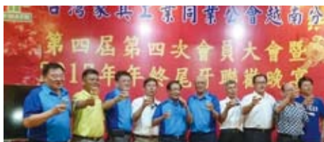
越南臺商家具同業聯誼會全體理監事舉杯共賀年終尾牙。