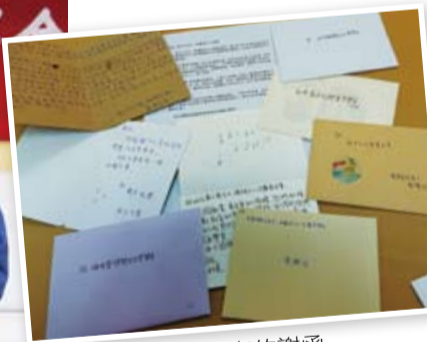
得獎同學給捐款者的謝函