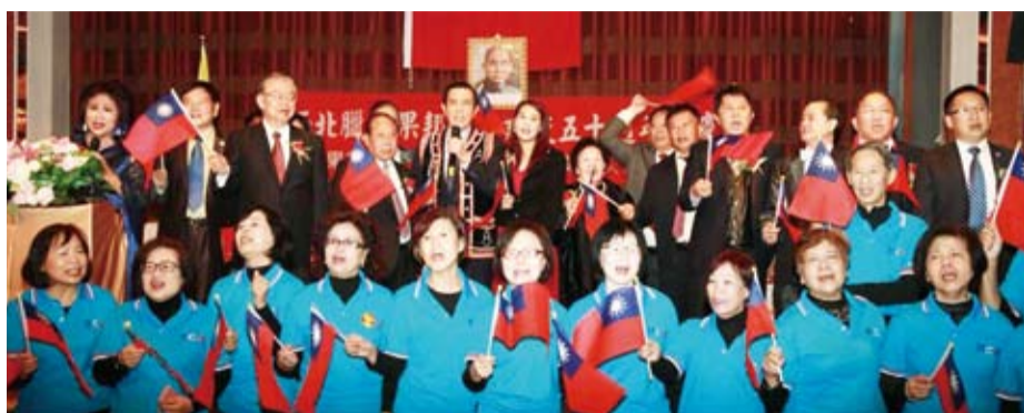
與會者合唱中華民國頌，後排左五是馬前總統，左四是鄭致毅理事長。

緬甸，就連當時僑委會委員長吳英毅要從泰國進去，也完全沒有機會，不過，就在他親自主持東南亞計畫，情況開始改變。馬英九說，當時一方面緬甸政局改變，接下來民國102年貿協在緬甸設立辦事處、103年外交部國際合作發展基金會在緬甸設辦事處、104年緬甸駐台北貿易辦事處成立、105年緬甸台北經濟文化辦事