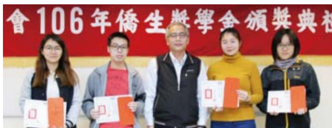
許派財監事（中）與得獎同學合影。