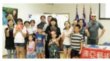
澳亞藝術交流協會舉辦小小快樂營文化研習活動。（轉載自宏觀電子報）