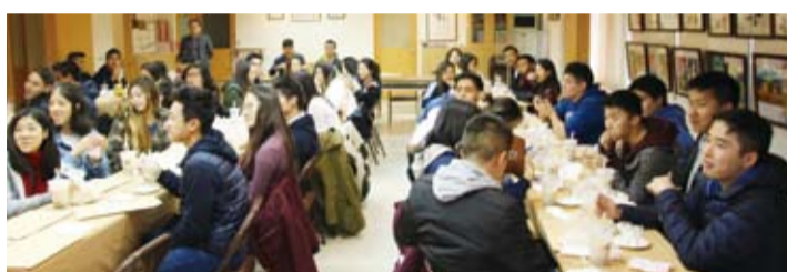
年青朋友享受台灣美食。