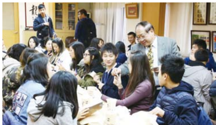
鄭理事長和團員一一打招呼。