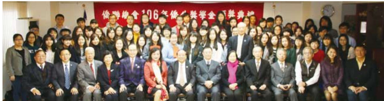
參加頒獎典禮的貴賓與得獎學生合影。