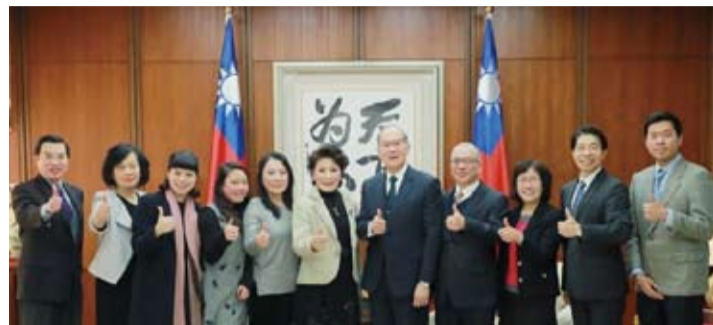
李部長(右五)與葉女士(左六)及曾任駐雪梨總領事之林錦蓮大使(右三)、李宗芬公使(左二)等人合影。