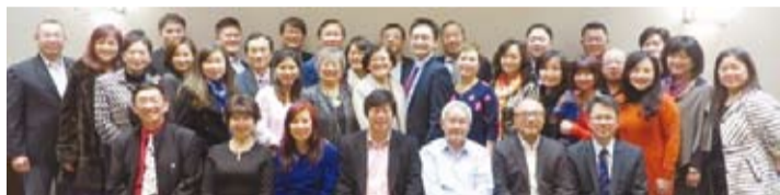
參加矽谷臺商論壇成員合影。