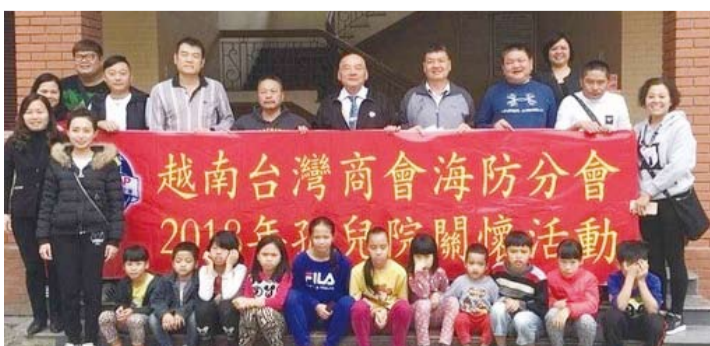
探訪海防孤兒院。(轉載自宏觀電子報)