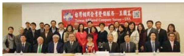
世界台灣商會聯合總會記者會。