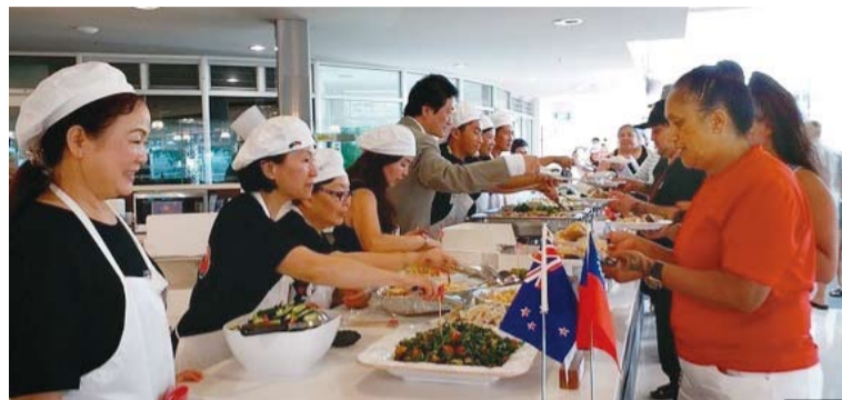
臺灣婦女會義煮團隊為來賓上菜。