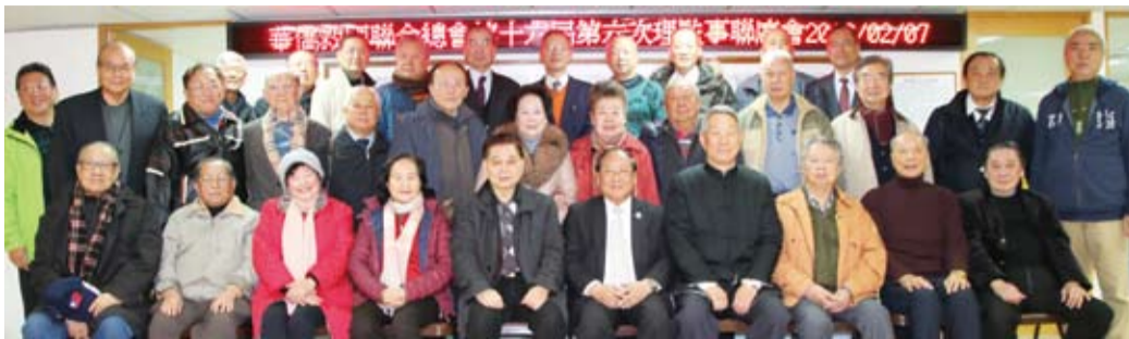
理監事會全體與會者合影。