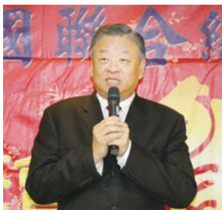
呂副委員長說僑委會與僑聯是最佳伙伴。