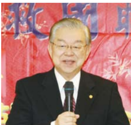
黃理事長要與僑聯攜手共同服務僑胞。