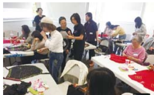
原住民背心製作。