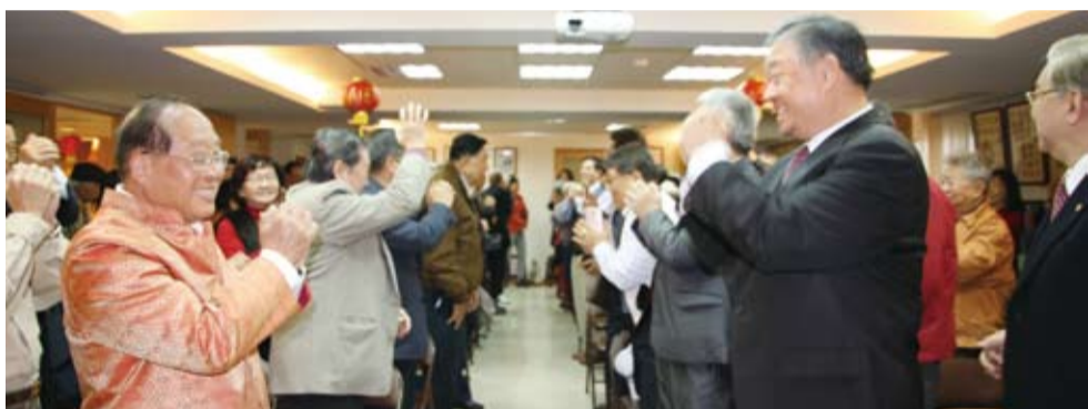
鄭理事長、呂副委員長等互道恭喜。