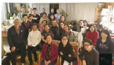
溫哥華白鷺鸞與水牛合唱團舉辦年會。(轉載自宏觀電子報)