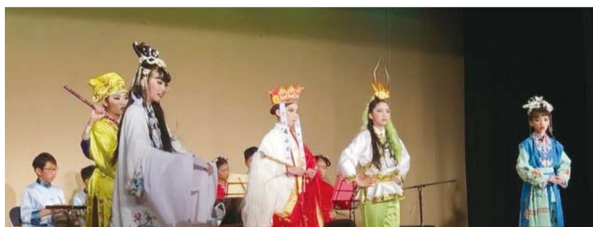
秀朗國小歌仔戲團洛城演出，廣獲讚譽。

洛杉磯／美國臺灣文化協會及美國臺灣人獅子會邀請臺灣秀朗國小歌仔戲團於1月20日在洛杉磯華僑文教服務中心公演「白蛇傳」歌仔戲，吸引近500人到場觀賞。