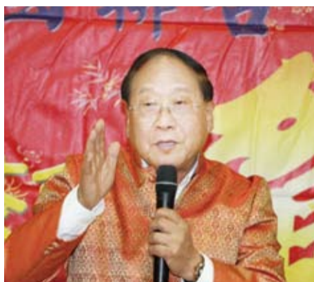
鄭理事長承諾加強服務僑胞。