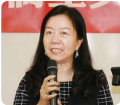
立法委員董惠珍希望同學珍惜各界的關愛。