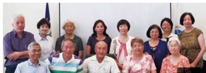
南美華文作家協會出席文友大合照。