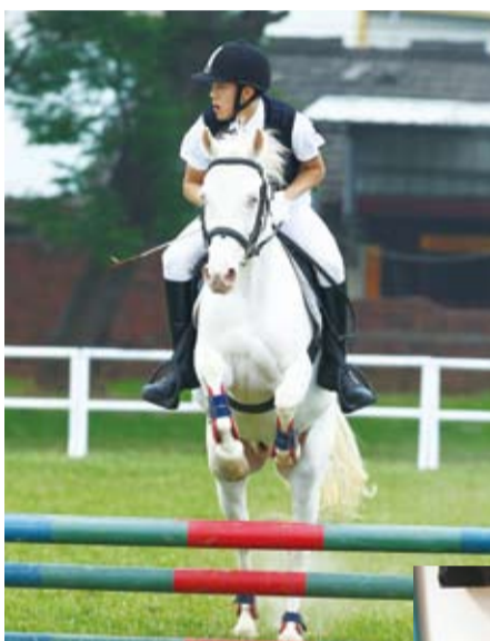
學生展現馬上英姿。