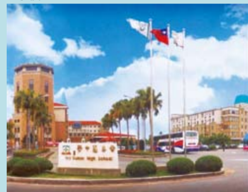
▼國內第一所被核准招收外國學生的常春藤學校。