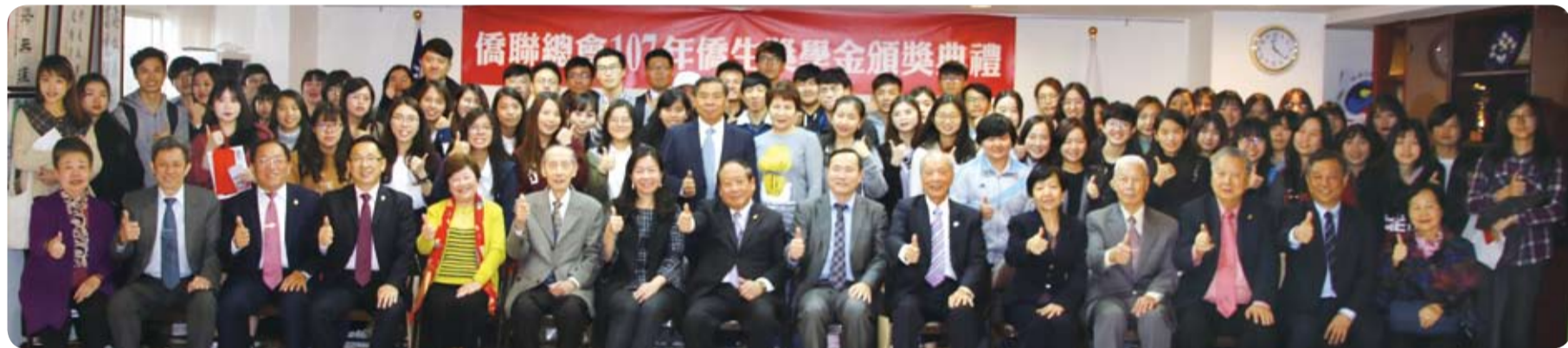
得獎同學與貴賓合影。