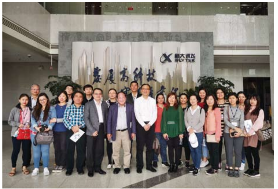
在科大訊飛集團，團員體驗互聯網科技蓬勃發展。