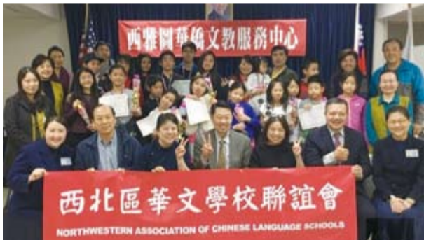
西雅圖僑校舉辦成語比賽，展現教學成果。(轉載自宏觀電子報)