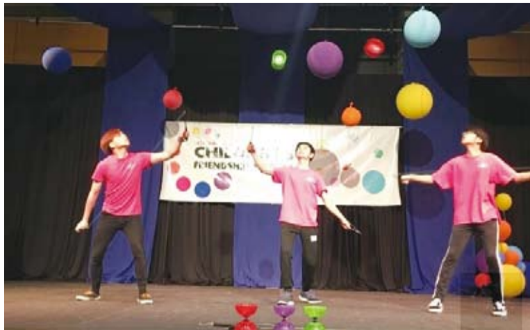
扯鈴高難度的拋接動作，獲得參觀民眾熱烈喝采與掌聲。