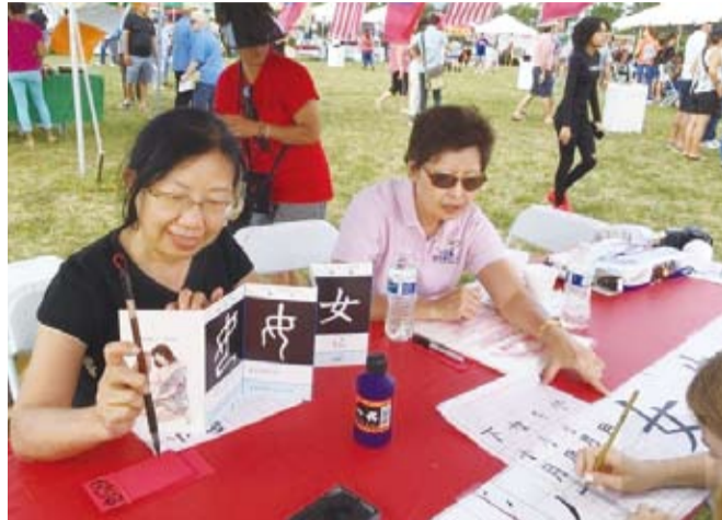
佛州珊瑚泉市世界文化日，中華文協大秀才藝。 (轉載自宏觀電子報)

西雅圖／第十屆西雅圖國際兒童節嘉年華會4月6日至7日在地標太空針塔旁兒童中心舉行，計有臺灣、日本、韓國、緬甸、印度等43個國家於會場中設攤展示各國族裔文化特色，並在主舞臺表演民俗舞蹈與技藝，參觀民眾與小朋友計約上萬人次。