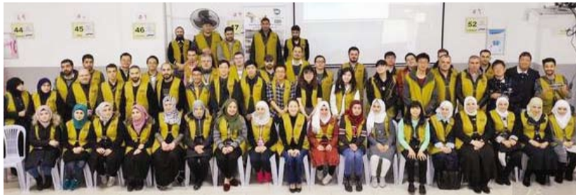
台灣學生傳達愛心到伊斯坦堡的滿納海國際學校。

當日適逢每月一次的慈濟發放活動於滿納海學校舉行，慈濟基金會在這裡每個月補助6000多戶的貧困家庭，讓難民生活得以維持下去。每次發放前都會讓敘利亞鄉親先唸誦古蘭經，接著由教長以阿拉伯文講道理給底下坐著的同胞聽，最後才是發放補助金。