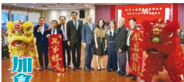
加拿大越棉寮華裔聯誼會 40週年會慶與會來賓合影。