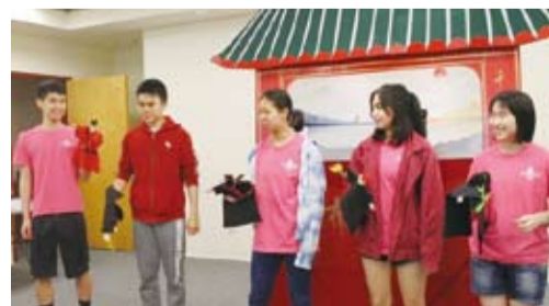
學員們分組介紹戲偶角色並上台表演，玩得不亦樂乎。

出具有個人特色之布袋戲偶；最後讓學員們分組表演，進行角色扮演、實地練習，學生們個個興致高昂，現學現賣以中英文口白操演戲偶，現場趣味橫生，笑聲