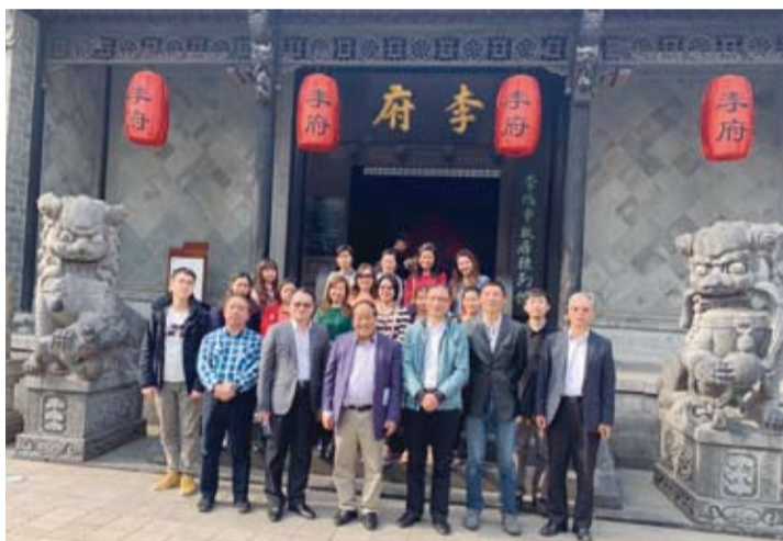
參訪團參觀李鴻章(左圖)、劉銘傳(右圖)故居，像進入歷史長廊。