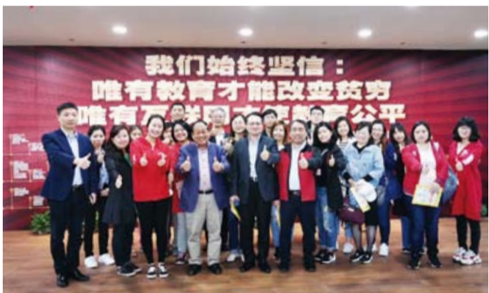
在螞蟻小鎮參觀，交流話題圍繞兩岸青年創新創業所開展的工作。

雖然只有短短6天行程，但參訪內容琳瑯滿目，有科技、有文化、有都市發展，團員對於到大陸就業、就學有了進一步認識，此行可謂成果豐碩、收穫滿滿。