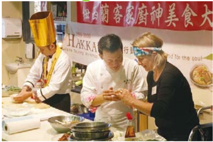
講師示範教學。