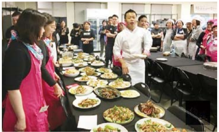
講座評選各隊佳餚。(轉載自宏觀電子報)