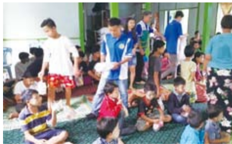
緬甸臺灣商貿會會員分發點心給院童。