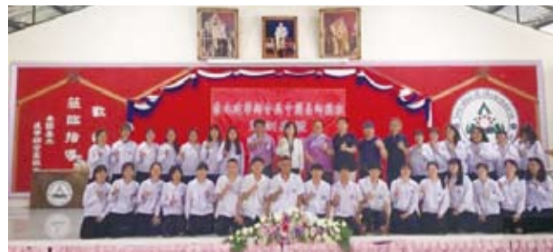
泰北簡易師範班開訓，傳承泰北僑教責任。 (轉載自宏觀電子報)

解決當地師資嚴重缺乏問題，自2002年起輔導建華綜合高中開辦簡易師範班，期在地化、系統化的培育華校師資。本年簡易師範班計有高一升高二班的30位同學選讀，他們未來將成為充