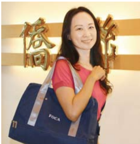
今年華僑節大會，本會致贈精美實用環保旅行包，國內外旅遊、運動健身攜帶方便。

大會預定10月11日(星期五)，上午9時至下午5時，在僑聯總會秘書處報到(台北市重慶南路一段121號7樓之16)；12日(星期六)上午8時至9時，