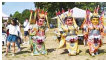
學員參與「臺灣日」園遊會，表演電音三太子。

園遊會中設置了40多個攤位，項目有臺灣美食、中醫義診、二手貨義賣、有機健康食品等。包括臺加文化協會、大溫哥華臺灣同鄉松齡會、世華工商婦女企管協