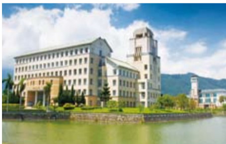
擁有優美景觀的東華大學，是網美造訪拍照打卡必到景點。