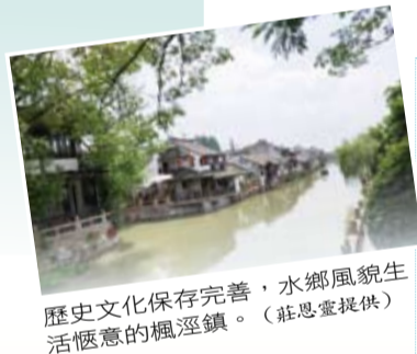
歷史文化保存完善，水鄉風貌生活愜意的楓涇鎮。

我認為人生中的每一個重大選擇或改變都需要抱持著落子無悔的心態，所以感謝這趟旅程開闊了我的視野，同時也為我帶來許多不可多得的緣分。讓我在舉棋不定的階段，多看一點棋盤上的局勢走向，下出更符合自己期望的一著棋。