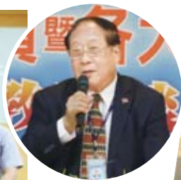
鄭理事長強調僑聯願意擔任平台角色，協助台灣大學院校招收境外生。