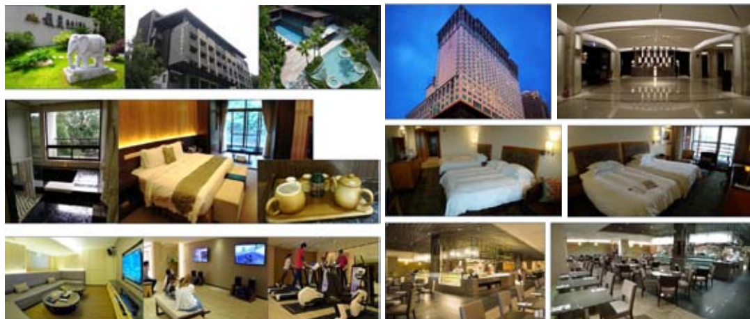
馥麗飯店內外設施。

參訪費用65歲以下，單人房現金價9,550元，雙人房每人現金價8,000元，65歲以上，單人房現金價9,480元，雙人房每