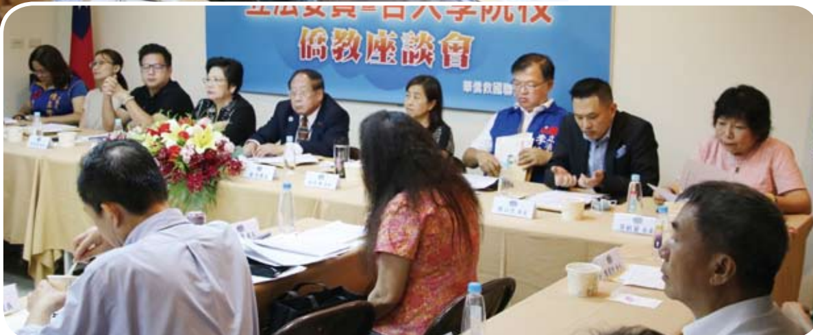
▶立法院8位立委大陣仗出席座談會，盛況空前。