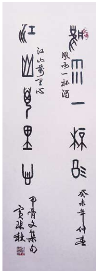
寶碧秋 風雨一杯酒 江山萬里心(甲骨文)