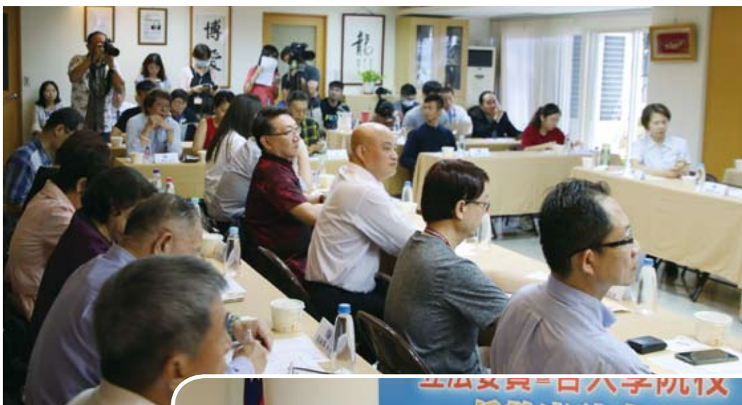
▲本會舉辦僑教座談，吸引電子與平面媒體採訪報導。

除立委們踴躍發言，與會僑學界代表也都熱烈表達意見，紛以第一線學校老師家長的角度，甚至學生所碰到的實際問題提出建議及看法。