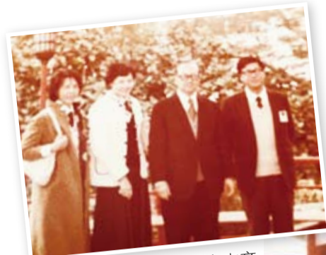
毛松年委員長（右二）和本文作者（右一）及女僑領合照。

袁頌安／1972年民國61年，蔣經國先生出任行政院長，力邀毛松年先生擔任僑務委員會委員長。由於毛公表現優異，深得層峰信賴，擔任委員長之職12年，是僑委會委員長任期最久的一位委員長。