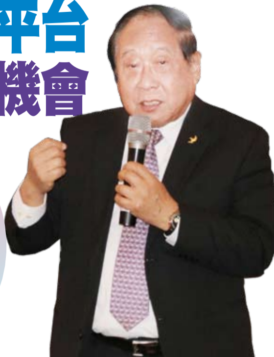
鄭理事長表示，僑聯成立宗旨就是服務僑胞及僑生 全力支持僑委會照顧全僑。