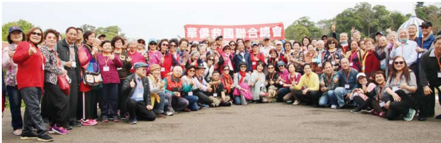
全體會員在風光明媚的西湖渡假村合影留念。

大會結束後，會員們先後前往雅聞香草植物工廠、台灣客家文化館，倘佯美麗花卉、多肉植物園；參觀各項客家文化相關展覽，再到大溪品嚐創意客家菜後返回台北，大家都覺得不虛此行。