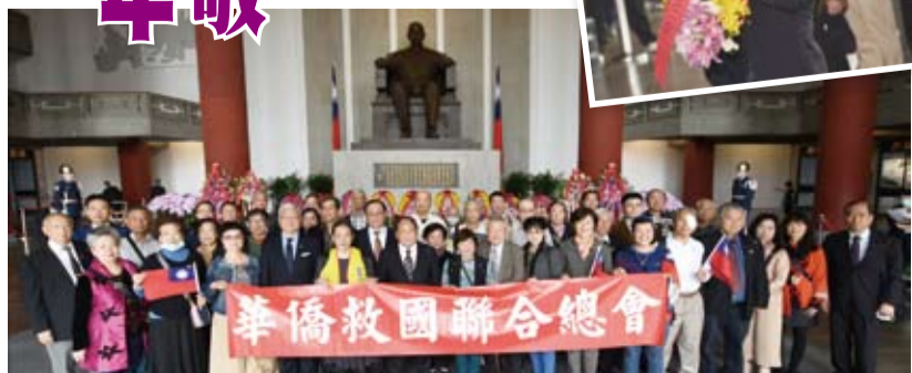
參加致敬儀式後，全體合影留念。