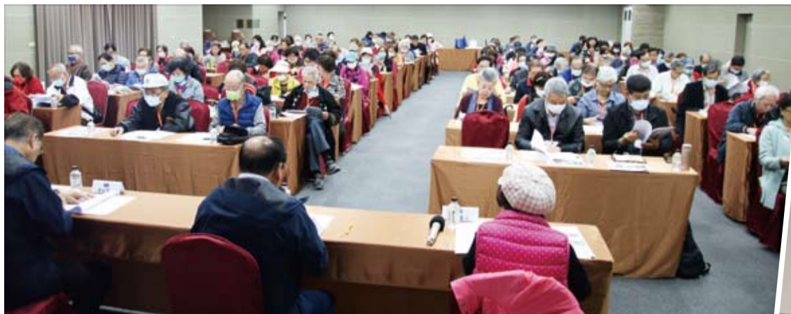
會員大會出席踴躍，整個會議廳座無虛席。

僑光社／台北 華僑救國聯合總會3月5日舉行第17屆第2次會員大會，討論通過110年度工作計畫、收支預算及109年度收支決算等多項議案。