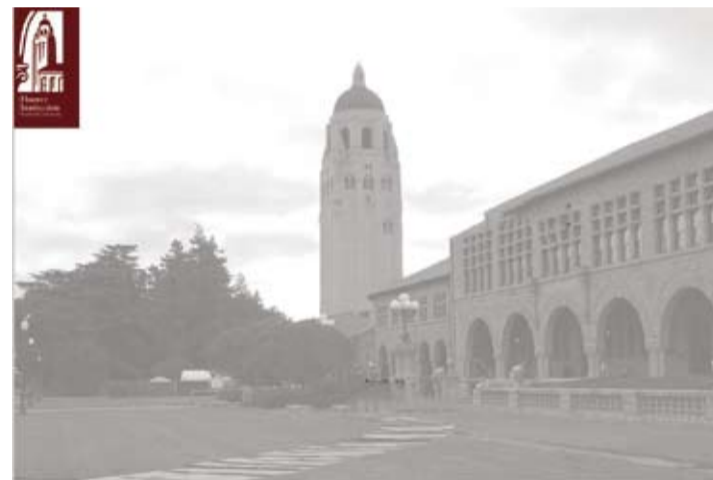
經國先生日記存放史丹佛大學胡佛研究院。