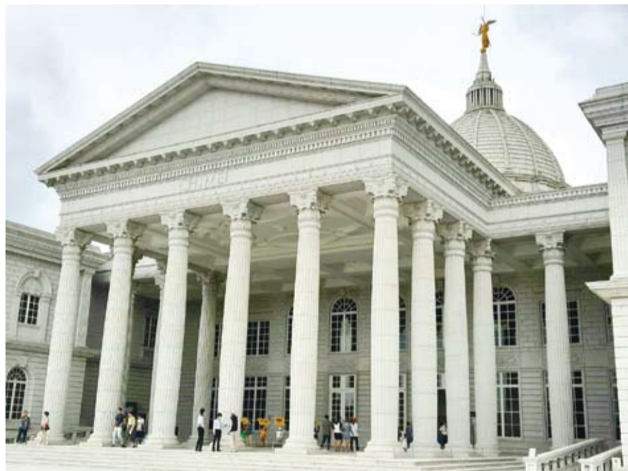
奇美博物館為奇美實業創辦人許文龍創立，是臺灣館藏最豐富的私人博物館、美術館。以典藏西洋藝術品為主，展出藝術、樂器、兵器與自然史四大領域。