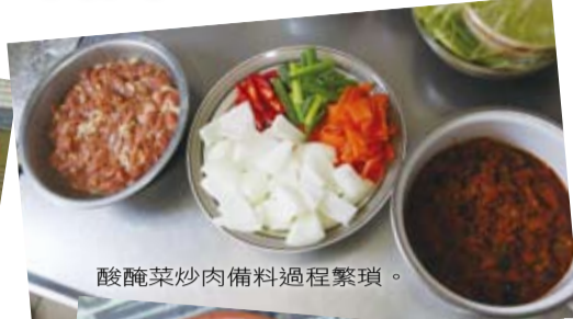
酸醃菜炒肉備料過程繁瑣。

「汽鍋」，早在2000多年前就在滇南民間流傳，雲南建水出產一種別致的土陶蒸鍋，是專門用來蒸食物的，最具代表性的名菜就是「汽鍋雞」，是雲南人的家常菜，也是上得了檯面的宴客菜。煮出來的雞湯鮮美，濃郁卻清爽，雞肉輕輕一夾便骨肉分離，是其他鍋具煮不出來的味道。汽鍋中間有一個氣嘴，有著中空的結構，直通向汽鍋底部，其烹飪原理就是將汽鍋放置於燒水的