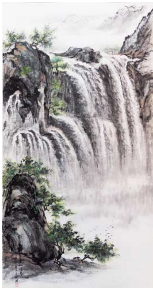
吳欞櫻 懸瀑似鳴琴