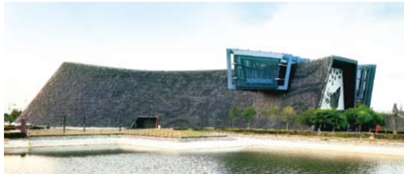
故宮南院總面積約70公頃，包含博物館區20公頃、園區50公頃，博物館建築由姚仁喜建築師設計，以傳統水墨畫之「濃墨」、「飛白」及「渲染」三種筆法為概念發想，發展出虛、實量體相互交織的流線形體。