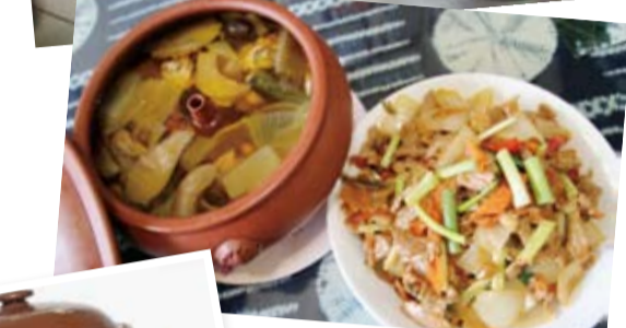
雲南餐桌上常見的家鄉菜：汽鍋雞與酸醃菜炒肉。