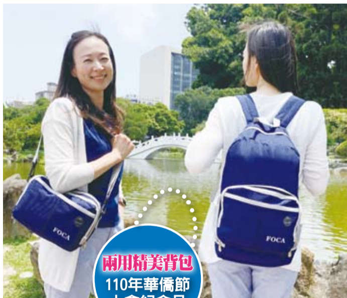
兩用精美背包 110年華僑節 大會紀念品