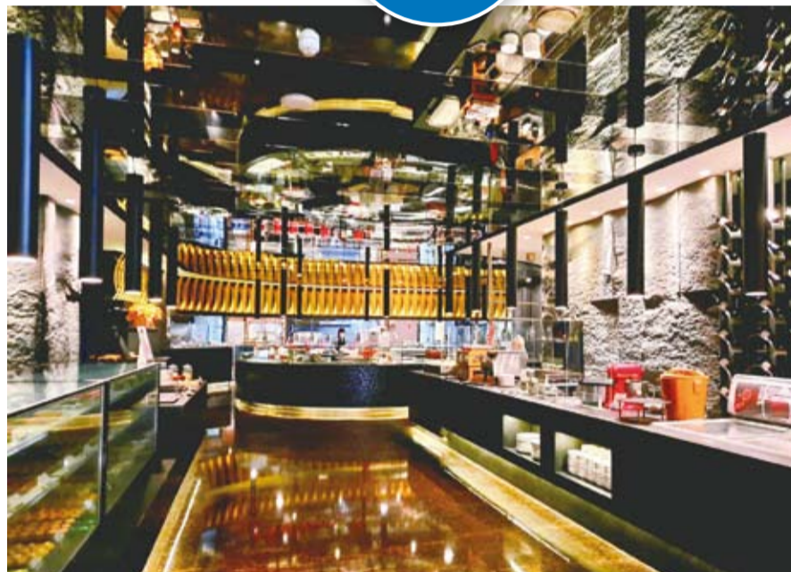
行程第二晚入住台南桂田酒店，酒店的阿力海百匯自助餐，提供百道以上無國界料理及下午茶。