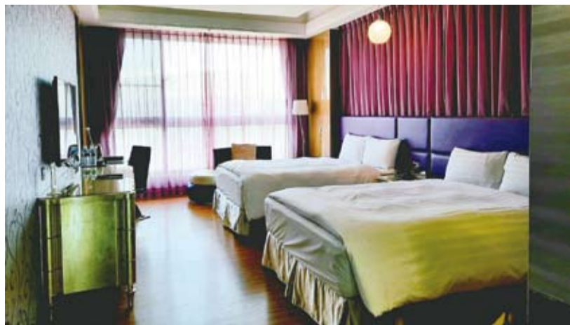
沿著台一線驅車進入雲林地區，兩旁青翠綿延，斗六棒球場邊的中台灣明珠，以亮麗身姿矗立，成為雲嘉平原旅途中最大驚艷—三好國際酒店。