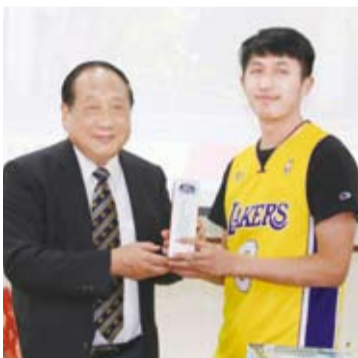
鄭理事長（左）致贈僑生代表實用紀念品。