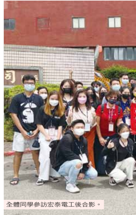
全體同學參訪宏泰電工後合影。