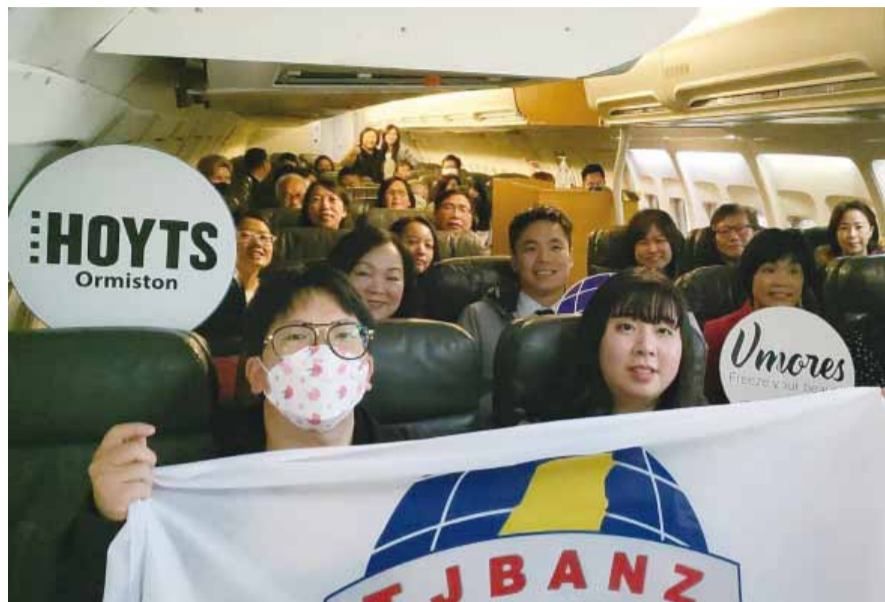
紐西蘭臺灣青年商會飛行講座機艙模擬體驗。

紐西蘭奧克蘭／紐西蘭青年商會最近在奧克蘭機場觀光學院舉辦別開生面的「飛行解密講座」。新穎的題材再加上青商新團隊的高人氣，活動吸引了僑界人士及各友會會長、臺灣移民新生代等共約 50 餘位前往支持參與。