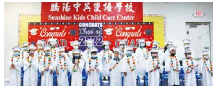
驕陽中英雙語學校畢業生合影。