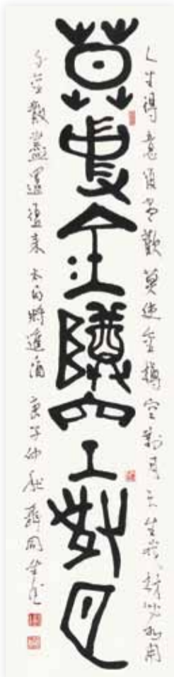
聶同生 節錄李白 將進酒莫使金樽空對月