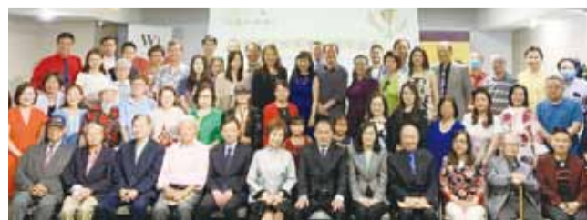
北美南加州華人寫作協會成立 35 周年慶暨「北美洲文苑文學獎徵文比賽」頒獎典禮大合照。