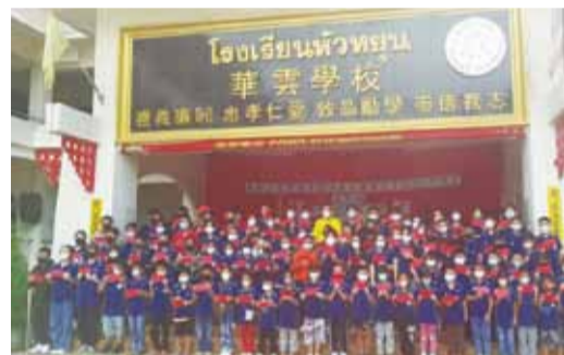
緬邊泰北泰國清萊雲南會館附屬華雲學校活動合影。

北美南加州／北美南加州華人寫作協會成立 35 周年慶暨「北美洲文苑文學獎徵文比賽」頒獎典禮最近於世