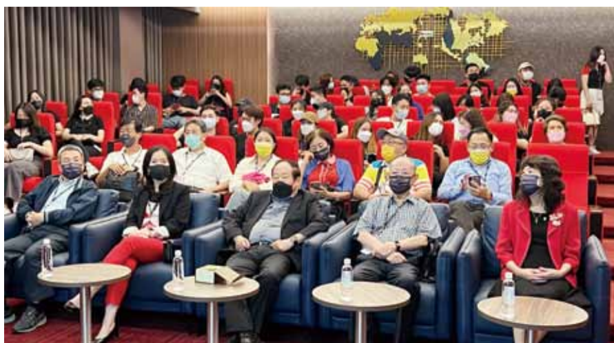
全體同學在世紀離岸風電公司聽取簡報。