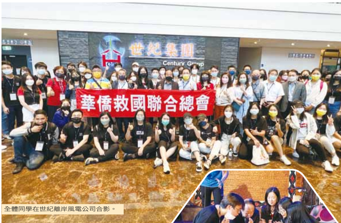
全體同學在世紀離岸風電公司合影。