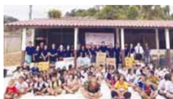
清萊雲南會館探訪團頒發慰問品後與回馬恩泉小學師生合影。

清萊雲南會館是寮邊，緬邊56個華人（義胞）村寨鄉親最重要的精神家園，數十年來會館承先啟後，秉持「家鄉人的家」團結族群，守望相助，支持泰北中華文