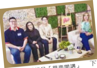
巴拉圭電視節目「華商開講」介紹中山僑校、STUDIO TAIWAN 101、臺式餐廳等有關台僑的故事。

校為東方市孕育不少優秀僑民子弟，跨度已歷經兩個世代，早年就讀的學生，如今也將他們的下一代送到中山僑校繼續學習華語文，特別