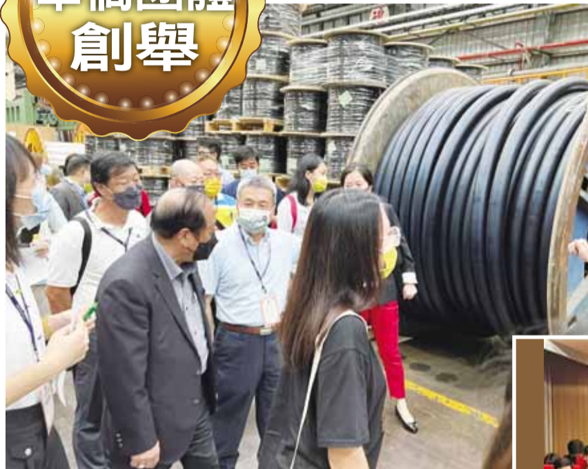
鄭理事長親自帶領同學參觀宏泰電工第一線作業情形。