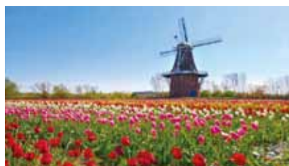
密西根荷蘭鎮各種不同品種和顏色的鬱金香，讓僑胞鄉親們大開眼界。

澳洲布里斯本／昆士蘭地區 2022 年 3 月初遭受破紀錄之連續豪雨侵襲，導致多個城市低窪地區嚴重淹水，鐵公路交通亦因此中斷，整體損失慘重。布里斯本臺灣僑界為表達對昆州政府災後重建工作之支持，僑務委