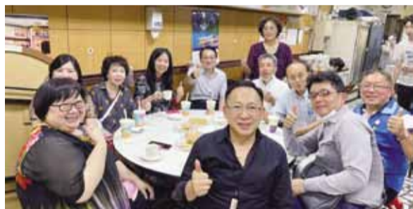
童委員（後排左三）在華新街品嚐地道美食，並與緬甸鄉親合影。