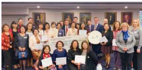
布里斯本僑界昆州水災募款出席貴賓合影。