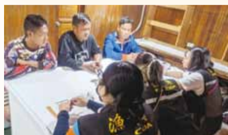
漁業署人員檢查斐濟港內我國籍漁船並訪談外籍船員。

斐濟／ 為系統性提升臺灣遠洋漁船外籍漁工勞動權益，透過漁業勞動檢查員提高漁業勞動檢查的覆蓋率，漁業署最近派遣4名檢查人員遠赴斐濟共和國之蘇瓦港實施漁業勞動檢查，檢查港內我國籍漁船並訪談外籍船