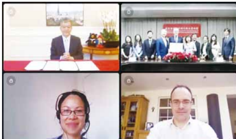
我與英國簽署「醫衛合作瞭解備忘錄」簽署會議畫面。