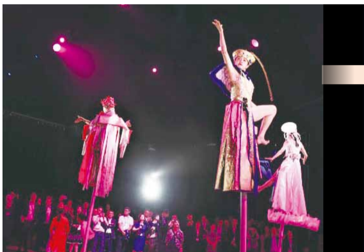
「默島新樂園」扮裝的高空傀儡，是扮仙的人偶也是金光閃閃的布袋戲偶。

傀儡，是扮仙的人偶也是金光閃閃的布袋戲偶，還有必不可少的陣頭與八家將等廟會元素，何曉玫更在舞作中安排檳榔西施、女學生、便衣刑警、阿兵哥、童子軍、象徵母親角色的紅衣女子等角色，為觀眾呈現解嚴前後動盪的時代軌跡，「默島新樂園」舞作匯聚臺灣多元文化圖騰，藉由廟會慶典與臺洋夾雜的亮閃浮世繪，為在場的250位外國貴賓們，呈現專屬於臺灣文化的生命情詩。