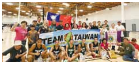
臺北市松山高中籃球隊球員們與美國橙縣僑界人士合影。