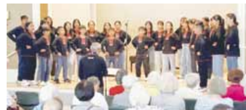
原聲童聲合唱團為美國灣區長者獻唱。

文友們依序就從AI發展趨勢對人類生活的衝擊、磨合、融合、藍海共贏表達理解與看法，並針對AI科技的躍升與未來的不確定性，依不同在AI人工智能生活上所遇到的狀況踴躍分享。