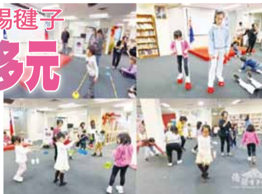
雪梨臺灣學校文化營隊精采多元。

過程中導師也特別強調品德教育，學生們必須遵守營隊規則外，也要保持禮貌與尊重他人；在「智育」部分，也讓學生增加臺灣國家公園、故宮博物院、布袋戲、臺灣戲曲的專業知識；此外，活動除了透