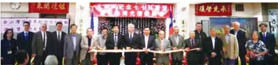
舊金山灣區僑界舉行紀念七七抗戰86周年暨文物展覽會。

委員會林大銳主任委員回顧抗戰史，表示，1937年7月7日，日本侵占盧溝橋後，國民黨政府領導全民抗戰八年，經歷重大會戰22次，大型作戰千餘次、小型戰鬥近4萬次，包括許多僑胞的官兵傷亡3百餘