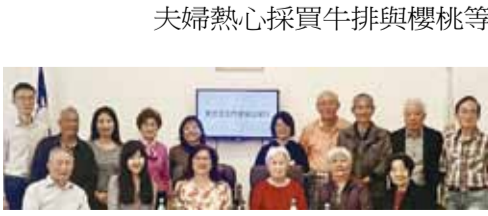
南美華文作家協辦文學座談會。