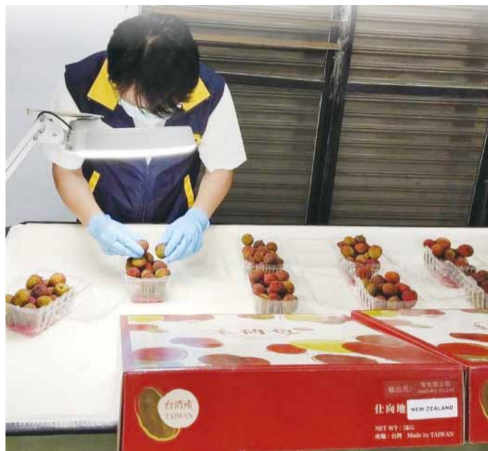
臺灣荔枝出口前須經過行政院農委會防疫局嚴格查驗。

紐西蘭／ 住在紐西蘭的臺灣僑胞有福氣了！繼去年起陸續恢復進口的臺灣芒果以及首次登陸的鳳梨釋迦接連進駐各通路讓消費者選購外，今年行政院農委會防疫局再度攜手產地果農、衛福部食藥署委託駐紐西蘭代表處經濟組與紐西蘭臺灣商會，突破紐西蘭嚴格的防疫檢驗要求，成功讓首批537公斤的臺灣荔枝於6月14日空運抵紐西蘭。