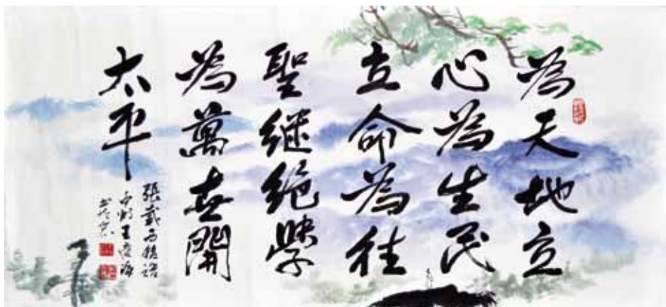
王慶海 張載西銘語