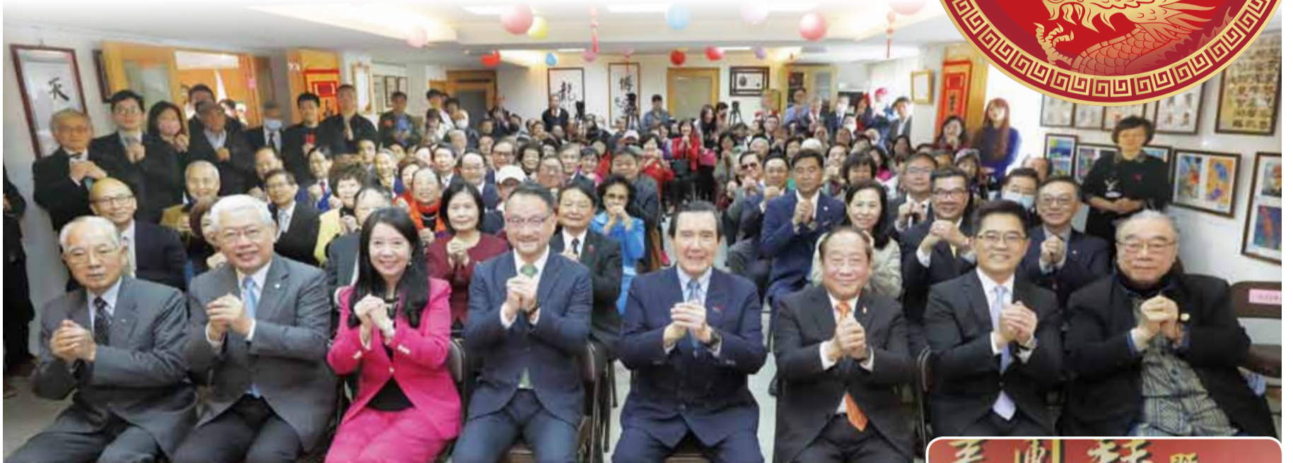
全場貴賓拱手賀新春。