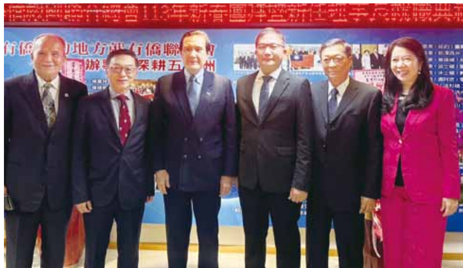
童理事長(右一)與馬前總統(左三)及貴賓們合影。