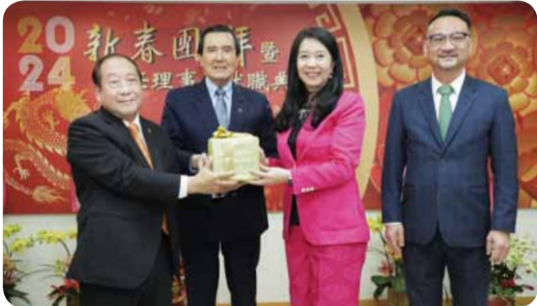
馬前總統（左二）監交，阮昭雄副委員長（右一）見證，鄭致毅理事長（左一）將僑聯印信交接給童惠珍理事長（右二）。

僑光社／台北 華僑救國聯合總會2月17日上午10時，在僑聯總會舉行第18屆理事長童惠珍就職典禮，馬前總統應邀監交並致詞。