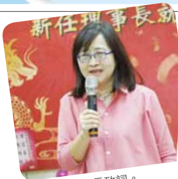
林奕華副市長致詞。